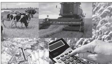
В Прикамье действует ступенчатая система поддержки агробизнеса

Губернатор Пермского края Дмитрий Махонин не раз отмечал, что сельское хозяйство остается одной из приоритетных отраслей экономики Пермского края. Поэтому для аграриев действует целый ряд мер господдержки.