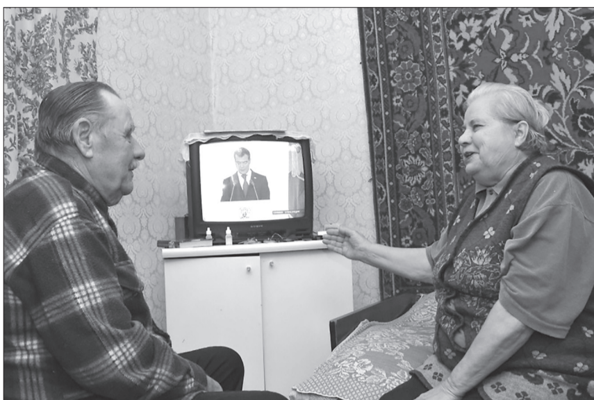
По поручению губернатора затраты при переходе на цифровое телевидение ветеранам Великой Отечественной войны, труженикам тыла и пенсионерам будут компенсированы из краевого бюджета