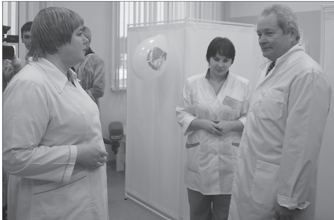
Специалисты физиопроцедурного кабинета: «Оборудование настроено. Готовы хоть сейчас принимать пациентов».

Принципиальное решение о начале строительства больницы в Уинском районе было принято в 2013 году, когда в ходе рабочей поездки глава региона Виктор Басаргин осмотрел старое здание хирургического отделения центральной районной больницы в Уинском,