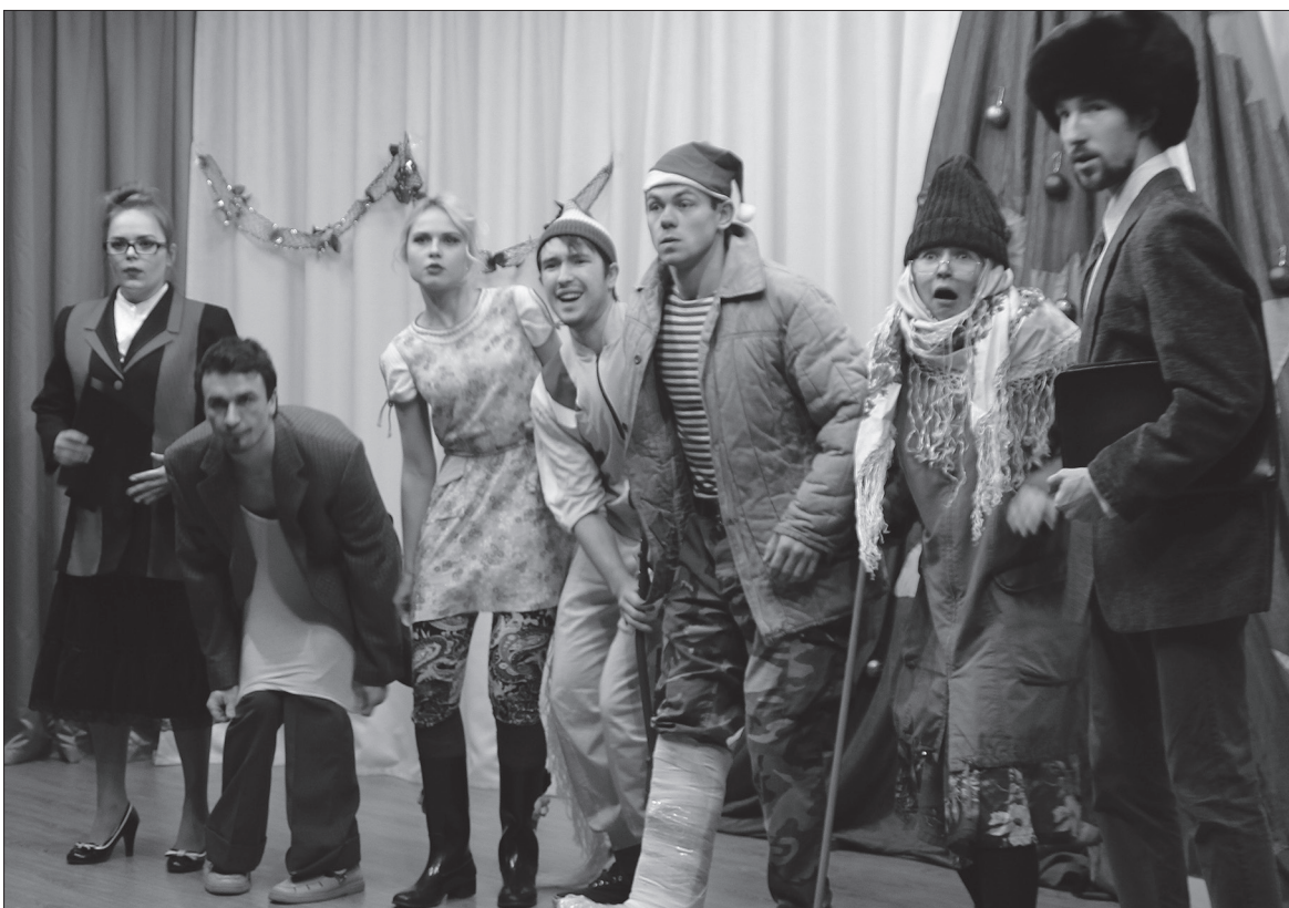
Еще один подарок от ООО «ЛУКОЙЛ-ПЕРМЬ» — премьерный показ нового спектакля пермского театра «Гистрион» «Новогоднее поздравление или к нам едет...» прошел на сцене Барсаевского СДК. Зрители приняли его «на ура».