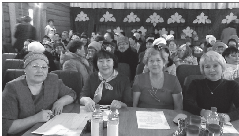
В обновленном интерьере Нижнесыповского ДК прошло уже не одно яркое мероприятие

В рамках проектов сделано уже немало. Так, в 2017 году 50 домов культуры и сельских клубов 23 районов Пермского края получили мощный толчок к развитию. Появилась новая звуковая аппаратура и световые установки, в залах установлены новые кресла, были приобретены сценические костюмы и многое другое. На эти цели по