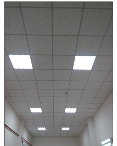
Нижнесыповской ДК не узнать. В прошлом году здесь заменили кресла и одежду сцены. В этом поменяли окна, двери, потолки