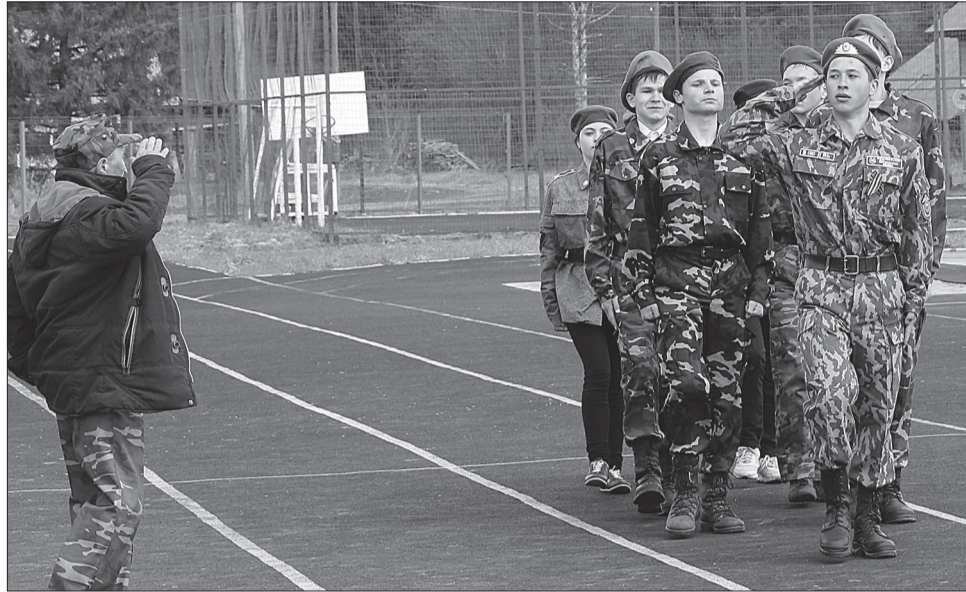
О том, кто победил в игре мы сообщим дополнительно

Программа мероприятия включала три этапа: военно-тактическая и строевая подготовка; физическая подготовка; интеллектуальный конкурс, в котором участникам необходимо было показать свои военно-исторические знания.