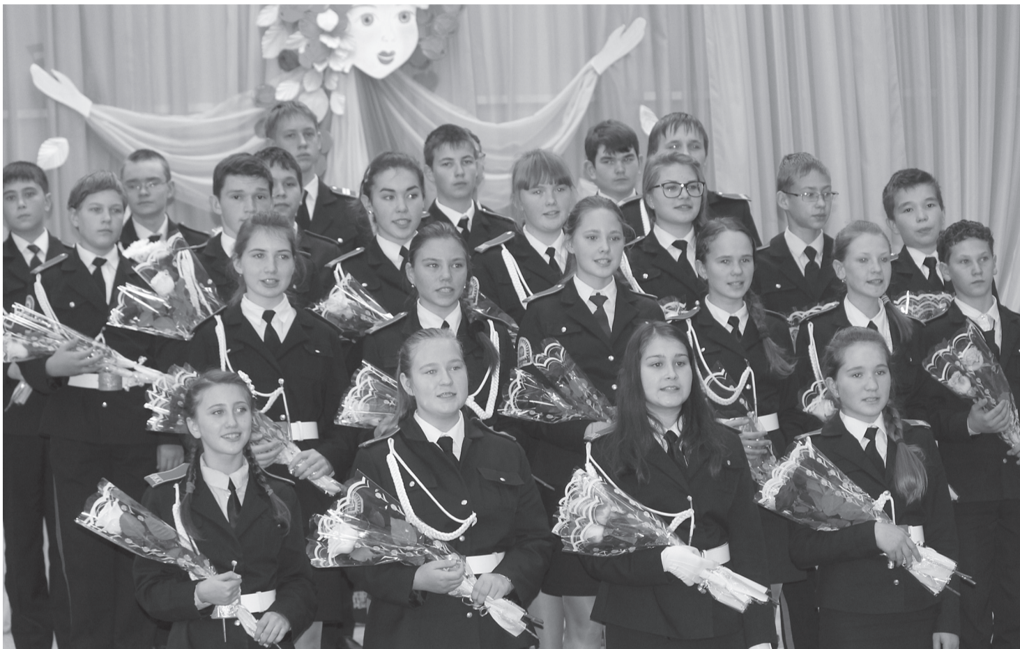
Хор кадетов. Больше фото с мероприятия вы можете посмотреть на нашем сайте

В этом году в ней приняло участие 7 команд