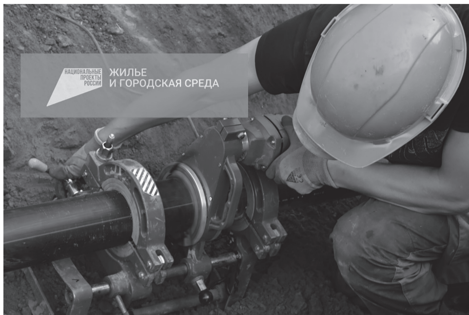
Проектно-сметная документация предусмотрена на обновление коммунальных сетей в 27 населенных пунктах.

По словам министра, в Прикамье за время действия программы уже реализовано 4 проекта. Так модернизирована система водоснаб-