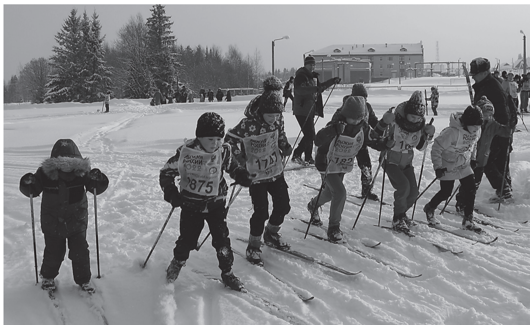
Первыми стартовали самые юные участники забега

Всероссийская массовая лыжная гонка «Лыжня России» на протяжении многих лет остается одним из самых масштабных зимних спортивных мероприятий не только в нашей стране, но и во всем мире. По количеству участников и географическому охвату этим соревнованиям нет равных. Даже после начала пандемии COVID-19 гонка не сдает позиции: в юбилейной, сороковой «Лыжне России» в 2022 году по всей стране суммарно приняли участие более 1,5 млн. человек.