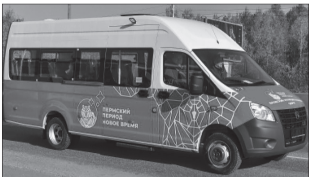
Все автобусы, которые будут работать по новой транспортной модели оформлены в едином «пермском стиле»

В соответствии с 220-ФЗ, ГКУ «Организатор пассажирских перевозок Пермского края» (ОПП) размещало на портале госзакупок откры-