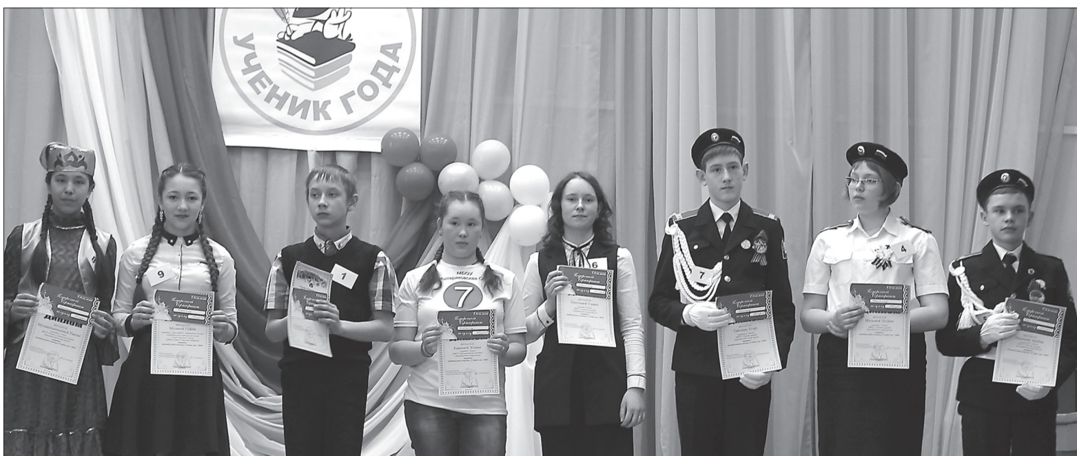
На фото: Лауреаты конкурса «Ученик года-2018»