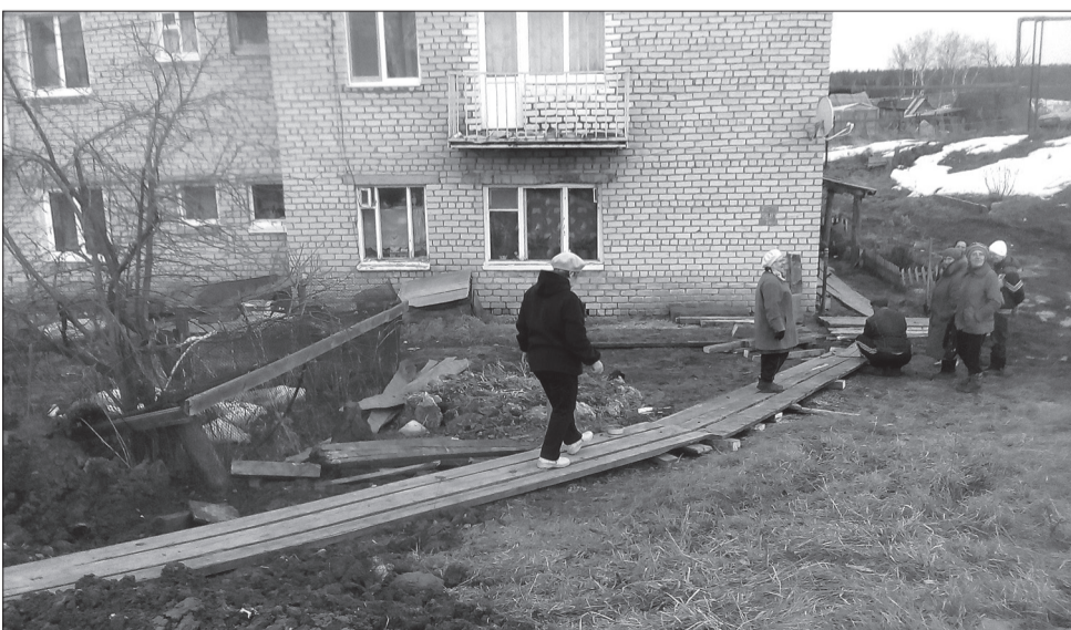
Не желая утонуть в грязи, жители дома по улице Свобода вышли на субботник и сделали себе тротуар

В марте здесь произошла авария на водопроводе.