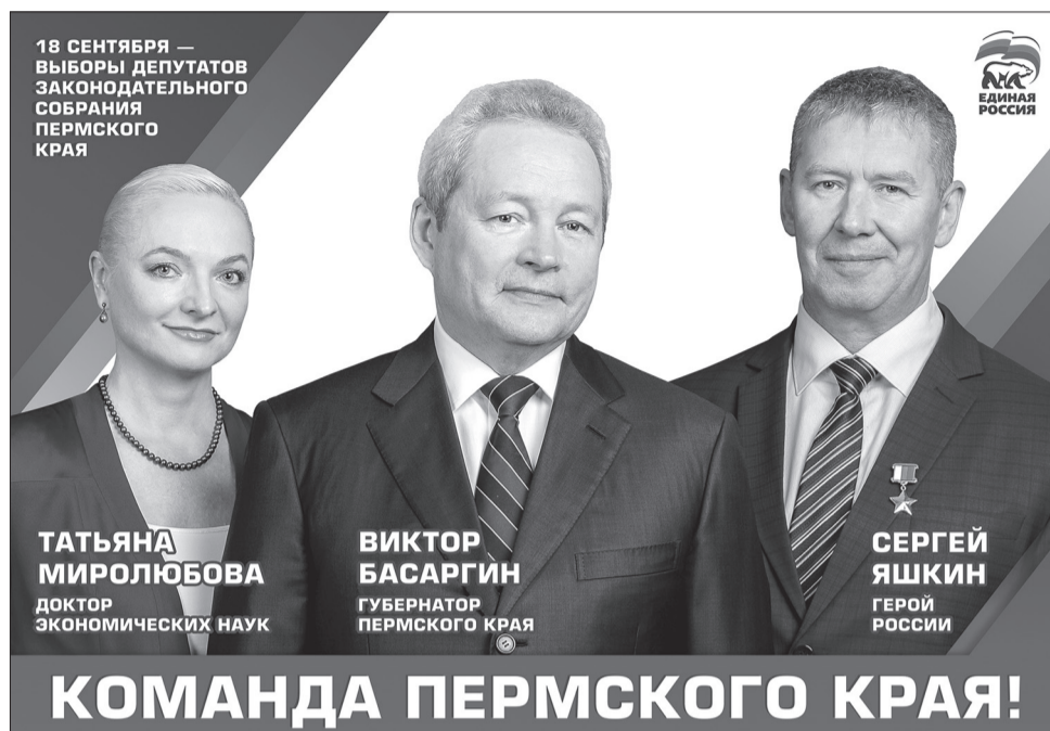
КОМАНДА ПЕРМСКОГО КРАЯ!

И на каждой встрече руководитель края прямо и честно отвечает на самые острые вопросы от собравшихся жите-