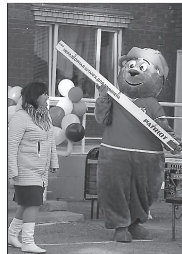
«Теперь у сорняков не будет шанса»

Татьяна ДЕНИСОВА Больше фото смотрите на нашем сайте