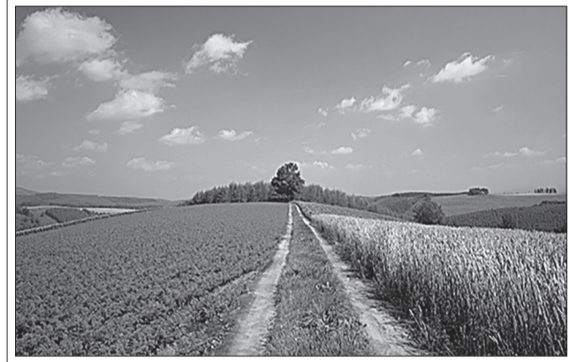
Дорога в забытый край, дорога в Детство, которое там прошло...

клятых» 18+ 02:30 «Секретные территории» 16+