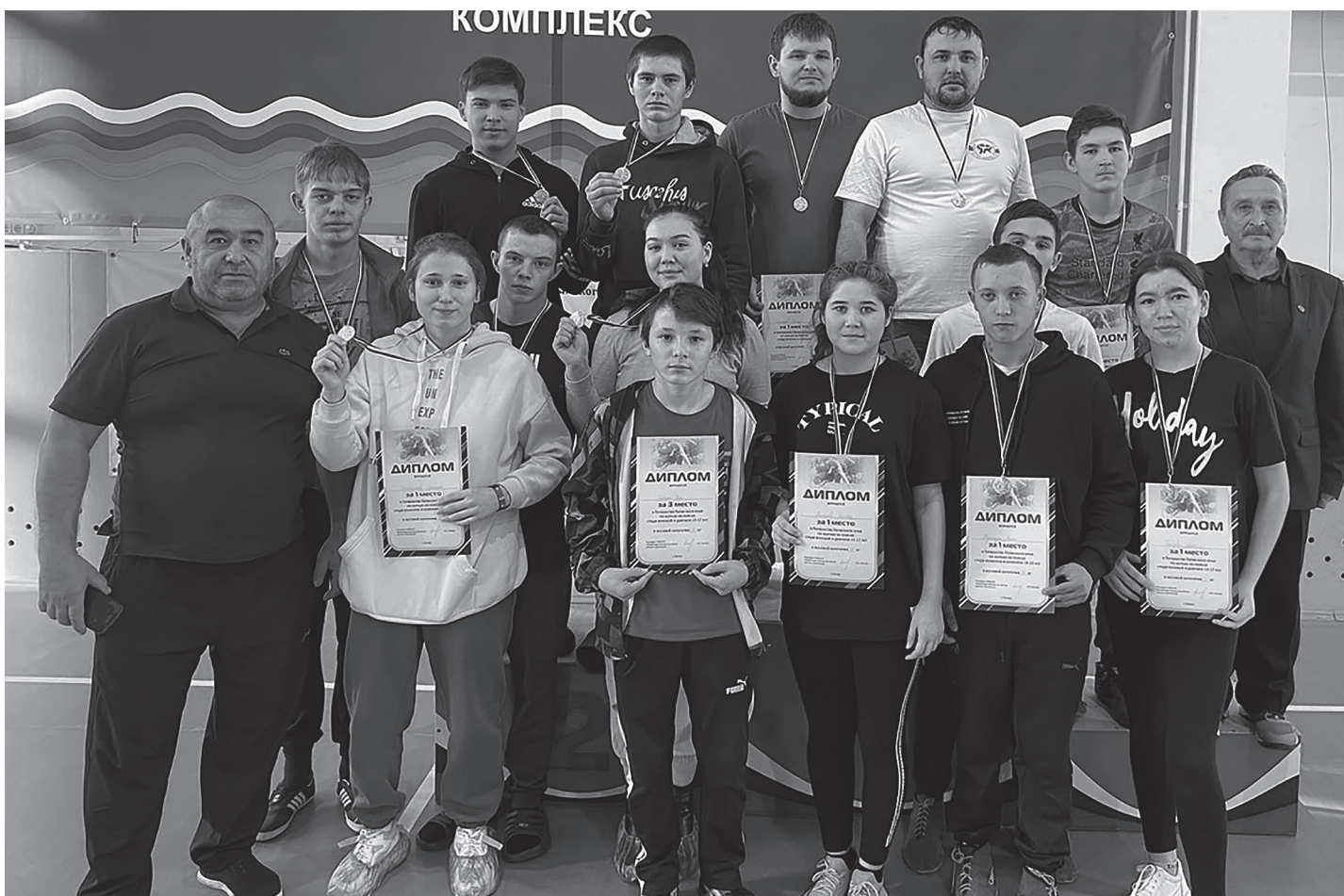
19 ноября в селе Барда состоялось первенство Пермского края по борьбе на поясах. Сборная Уинского округа вернулась оттуда с целой россыпью медалей. Больше спортивных новостей читайте на с. 8