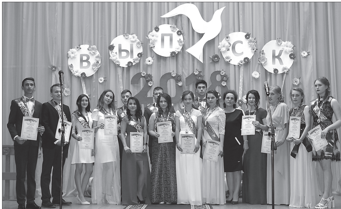
Победители номинации «Умники и умницы»