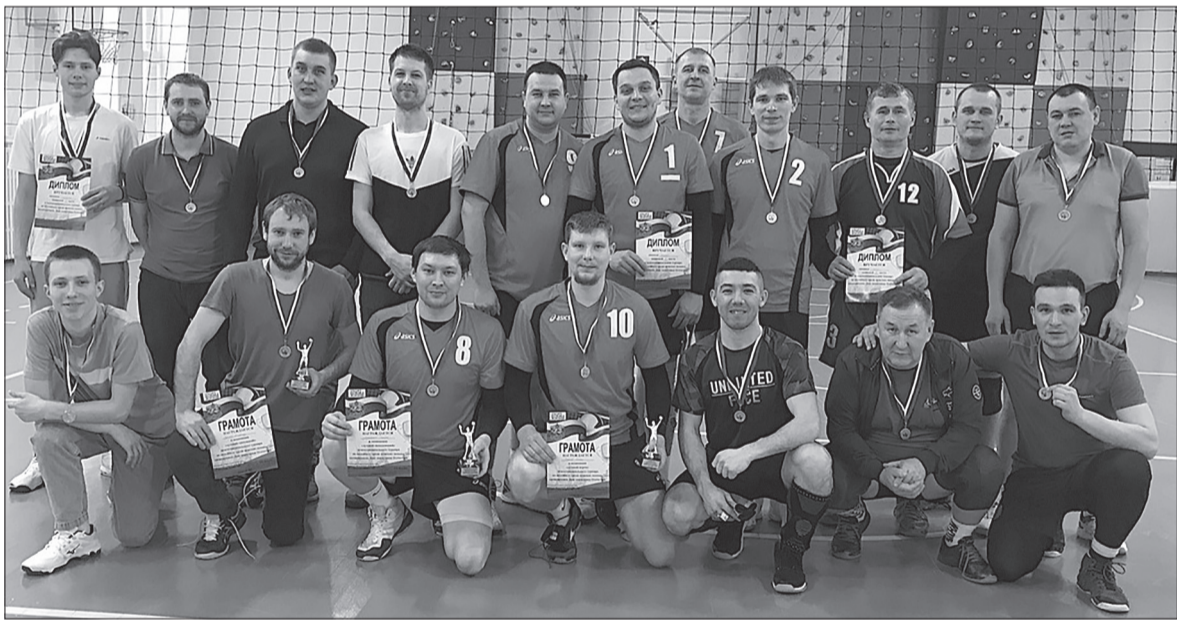
Призеры волейбольного турнира

бимова, а уже решили выйти посоревноваться. Конечно, и падают, и делают неточные пасы, но это же только начало! Главное – у них есть огромное желание играть в хоккей, а все остальное будет достигнуто в результате тренировок и их личного усердия.