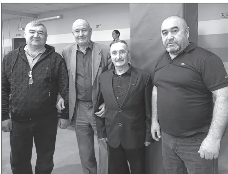
«Кузнецы» побед Уинских борцов