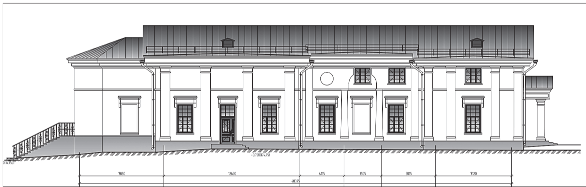
По проектной документации срок выполнения работ по реконструкции ДК в с.Уинское – 10 месяцев.

на программу выделяется порядка 6,8 млрд. рублей. Предполагается реализовать 90 мероприятий в рамках программы уже в 2023 году.