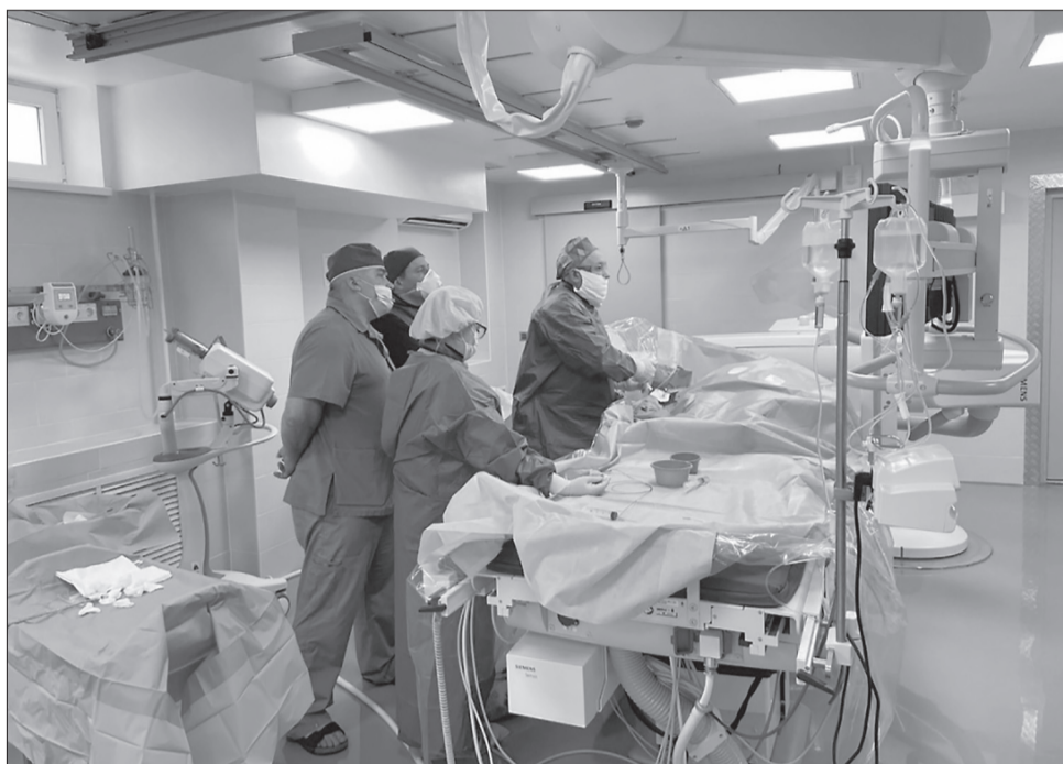
Оборудование помогает проводить обследования и лечение.

«Недопустимо затягивать с полноценным запуском медучреждений, с их переоснащением по причине несогласованных действий по поставке и монтажу оборудова-