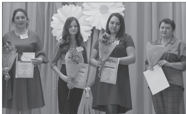
Призеры второго этапа конкурса