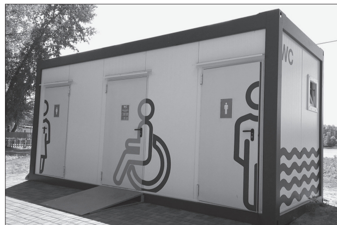
Примерно так могли бы выглядеть общественные туалеты в селе

Как запасной вариант прорабатываем строительство очистных сооружений совместно с соседями из Ординского и Октябрьского районов, где-нибудь на стыке границ. Чтобы этот проект финансировался из средств бюджета нескольких муниципалитетов.