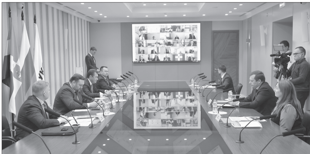
25 глав территорий Прикамья подключились к церемонии подписания соглашений в формате ВКС

— Помимо этих двух глобальных строек, запланированы несколько больших проектов в территориях. Например, в Осе продолжим благоустройство фонтанной площади, а в Чайковском — набережной. В Чернушке начнётся строительство нового стадиона, а в Пермском районе, Уинском