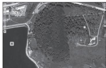
Проанализировав кучу снимков ученые предположили, что в Московской горе есть подземная пещера