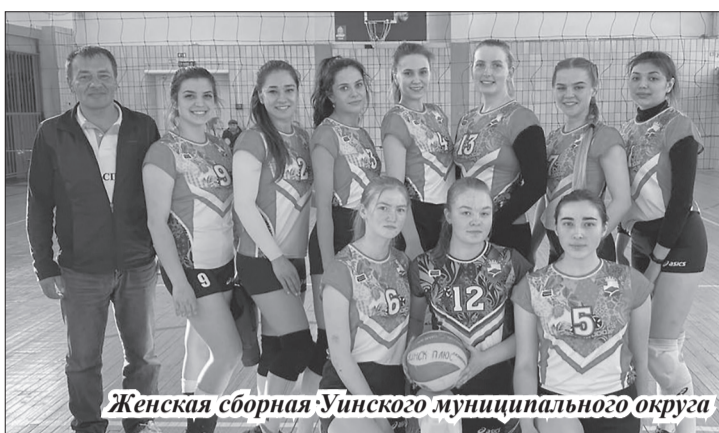
Женская сборная Уинского муниципального округа