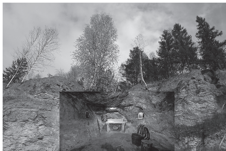
Примерно так будет выглядеть видеоинсталляция пещерного храма

Возможно раньше здесь была каменоломня, а уже после кержаки, гонимые официальными властями,