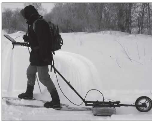
Прежде чем лезть в гору поэкспериментировали с прибором на равнине.

На портале LandViewer эксперты-географы проанализировав геомагнитные снимки из космоса сделали предположение о наличии пустот в Московской горке. Но надо смотреть подробнее прямо на местности. Думаю взять в аренду