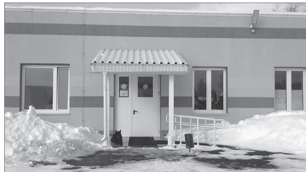
В новой амбулатории обслуживаются 3,5 тысячи жителей.

В 2021 году в эксплуатацию введут ещё несколько новых зданий. В том числе детские поликлиники в Кудымкаре, Свердловском и Орджоникидзевском районах Перми, СВА в Савино, Гамово и Зюкайке.