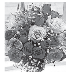
Жена, дети, внучка

Твой юбилейный день рождения Отметить рады мы сейчас. И от души хотим все вместе Здоровья, счастья пожелать Чтоб радость в доме поселилась И оставалась в нем всегда, Любовь чтоб сердце наполняло И дружно была семья!