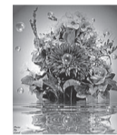
Сафины, Дускаевы, Мирзяновы

Желаем здоровья, желаем успеха, Чтоб слёзы блестили только от смеха, Чтоб счастье и радость в улыбке светились, Чтоб все пожелания осуществились.