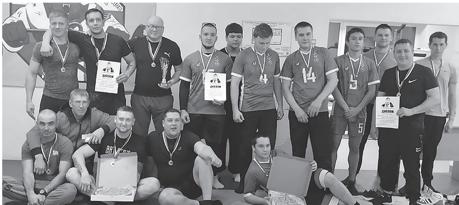
Ответ на этот вопрос 3 ноября искали 3 команды

В России всегда существовало 2 вопроса: «Кто виноват?» и «Что делать?», но недавно появился еще один – «В чем сила?»