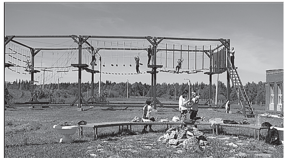
В дополнение к полосе препятствий и веревочному парку в Уинской школе появится открытая спортивная площадка

– Население обслуживает 20 врачей и 65 средних медицинских работников. Для решения проблемы с обеспеченностью медучреждения узкими специалистами реализуется программа «Земский доктор/Земский фельдшер» и совместно с медуниверситетом проходит целевое обучение студентов с их дальнейшим обязательным трудоустройством в Уинскую больницу. В частности, по программе «Земский доктор/Земский фельдшер» уже в этом году учреждение примет