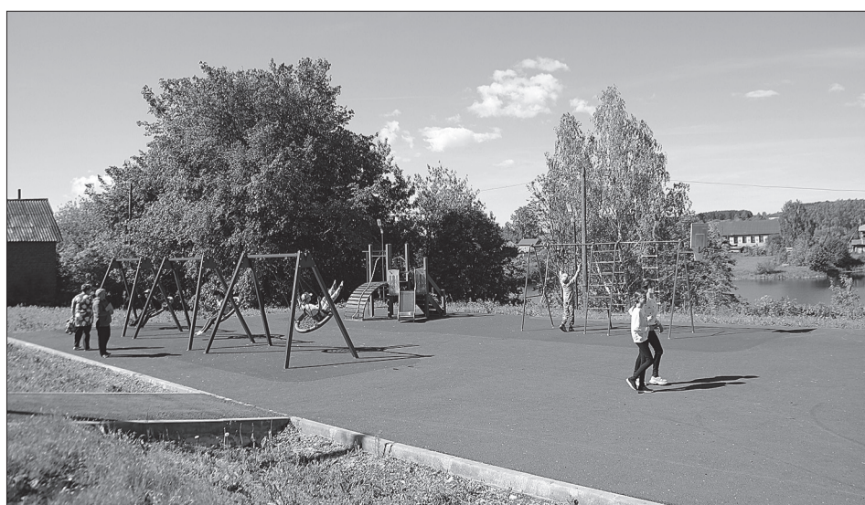
В 2023 году планируется завершить благоустройство общественной площадки в с.Суда

«Точек роста» откроются в сельских школах Пермского края к 2024 году.