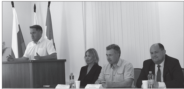
17 июня в администрации Уинского округа по инициативе депутата прошла встреча аграриев с представителями Россельхозбанка и Ассоциации фермеров Пермского края