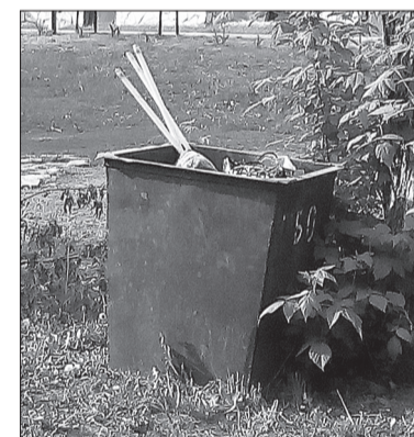
Уинское. Районный парк. 6 июня 2016

Если вам безразлично здоровье ваших детей, не выкидывайте люминесцентные лампы в мусорные баки. Неправильная утилизация ламп может отразиться на здоровье из-за ртути, попавшей в воду, в воздух, в почву.