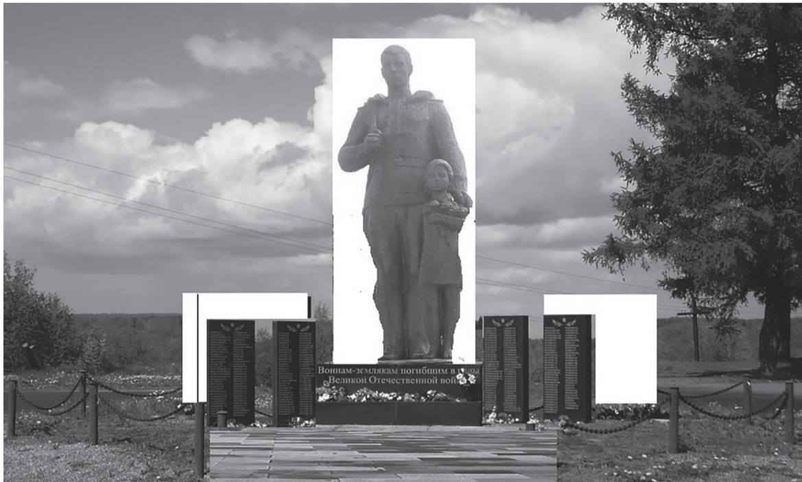
В с.Барсаи планируют отремонтировать памятник в честь героев Великой Отечественной войны