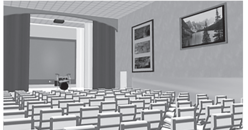
Оснащение актового зала МБОУ «Уинская СОШ» до и после реализации проекта