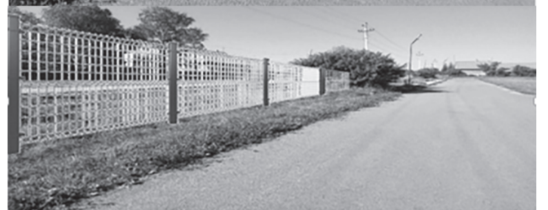
Устройство ограждения школьного стадиона с. Аспа