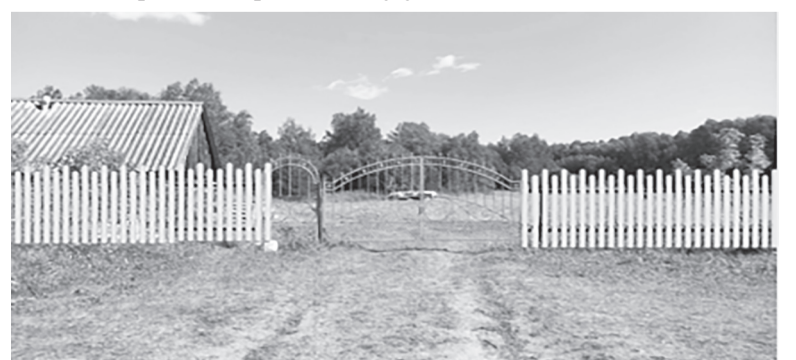
Устройство ограждения мусульманского кладбища с. Чайка