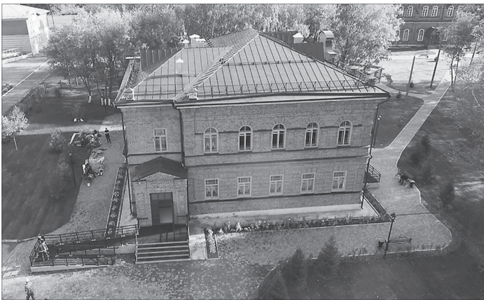
Судинский ДК и библиотека переехали

В 2020 году желаю всем стабильности, реализации намеченных планов. Крепкого здоровья и всего самого наилучшего.