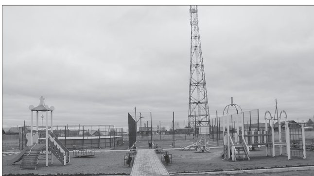
с.Уинское, площадка на ул.Светлая