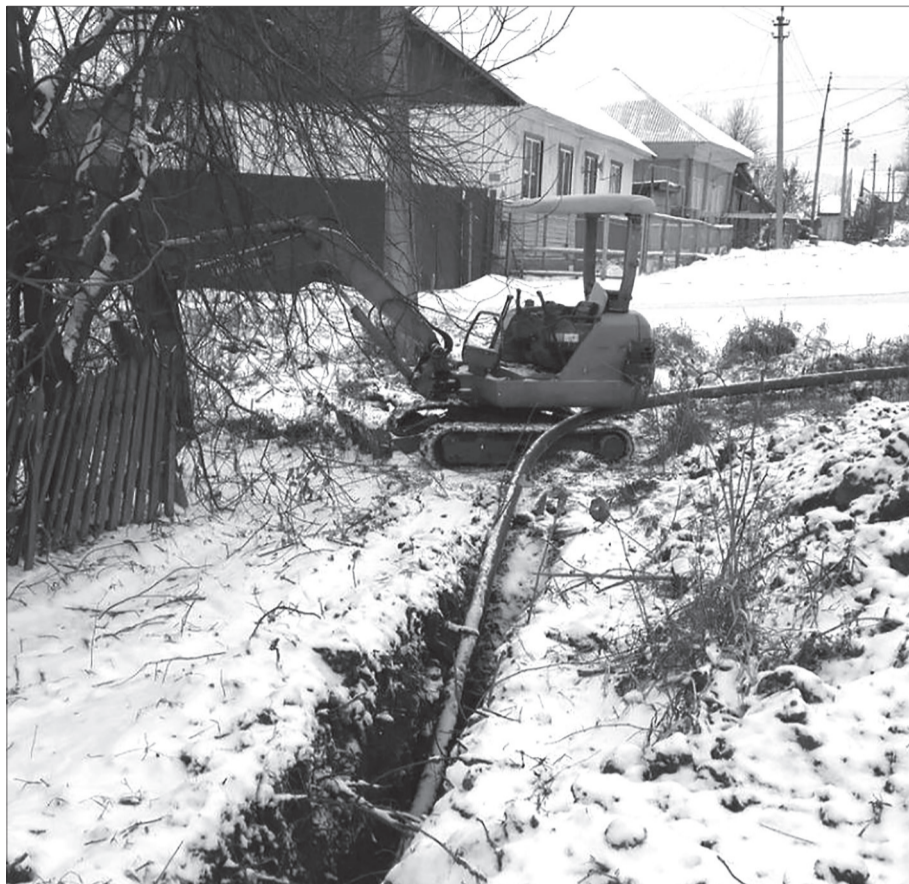
В 2021 году планируется завершить газификацию с.Уинское. В 2019 году распределительные сети газопровода прокладывались на улицах Космонавтов, Калинина, Мира, Дружбы, Набережная. Было построено 3,3 км сетей.