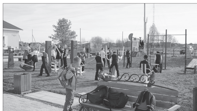
с.Аспа, площадка у ДК