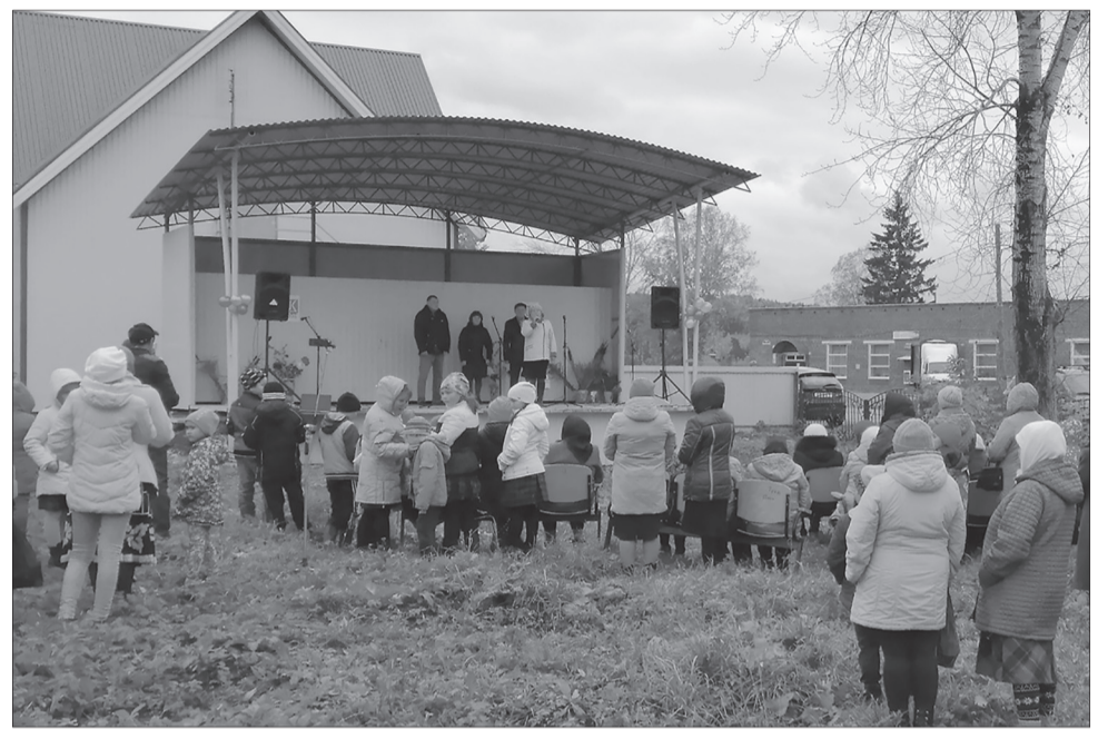
Недалеко от ДК в с. Чайка появилась летняя сцена

В 2020 году завершается еще один крупный проект — реконструкция ГТС пруда в с.Суда.