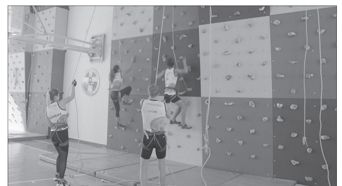
Скалодром в Уинской школе