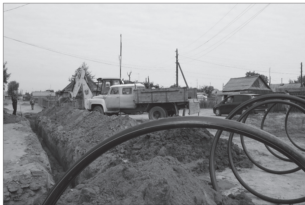
Администрация ставит амбициозную цель: завершить газификацию Уинского района к 2021 году

— Я тоже слышал такие предположения. Но это только домыслы. Никаких реальных предложений не поступало. На самом деле «теплых» мест не бывает. Везде нужно работать. И работать эффективно. На сегодняшний день я руководитель территории. И планирую работать на благо Уинского района. У нас сформировалась сильная команда администрации — это признается и на краевом уровне. Мы развиваемся опережающими темпами. Благодаря отличному партнерским взаимоотношениям с компаниями «ЛУКОЙЛ-ПЕРМЬ» и «Газпром газораспределение Пермь» на 2017 год мы поставили перед собой решение целого ряда серьезных задач. Думаю все у нас получится.