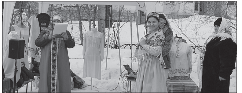
А вы знаете, что... платье невесты не всегда было белым