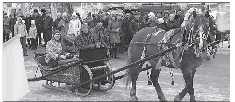
Венец свадебной церемонии – жених везет невесту