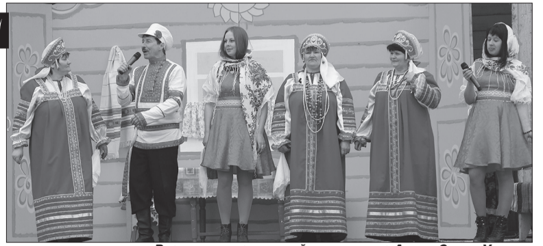
Развлекали зрителей артисты из Аспы, Суды, Уинска