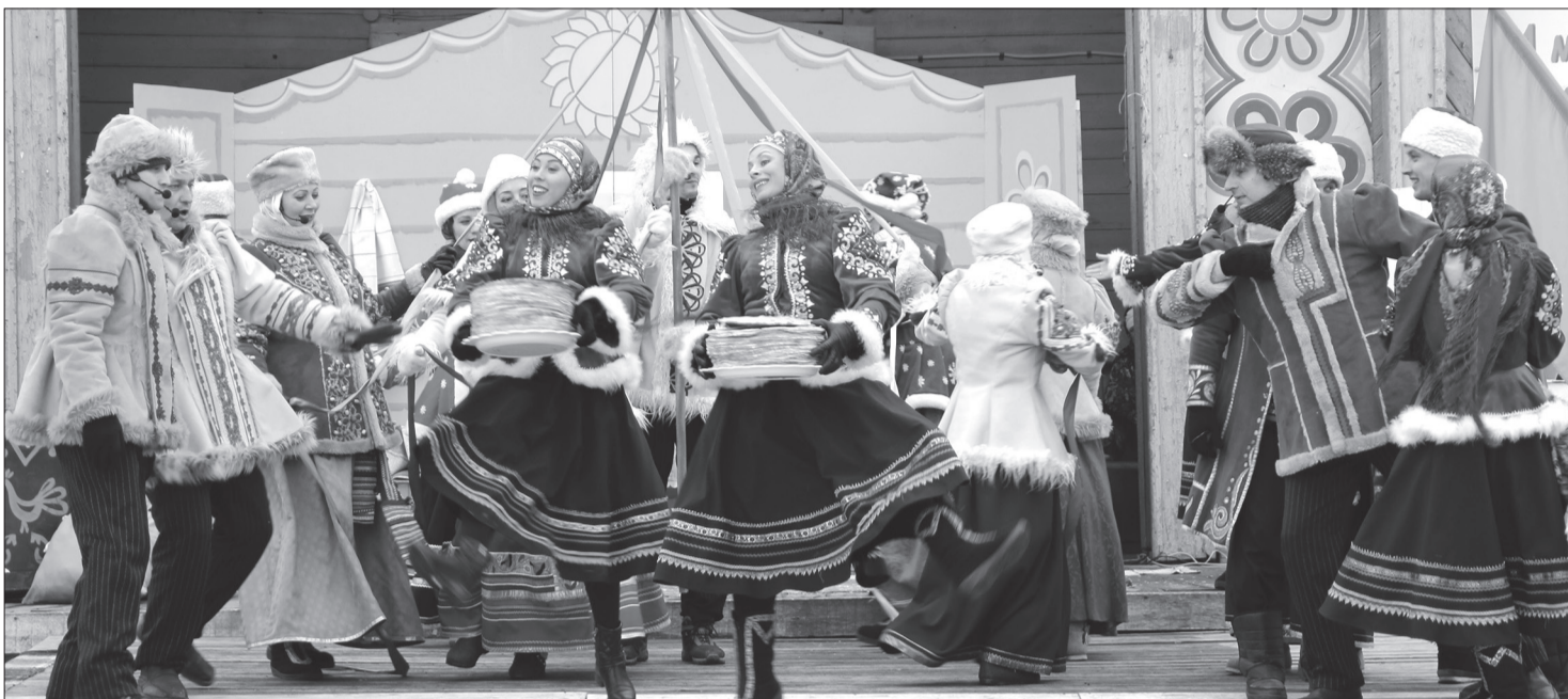
В минувшую субботу в райцентре прошли масленичные гуляния. Подробности на с.3 и на нашем сайте