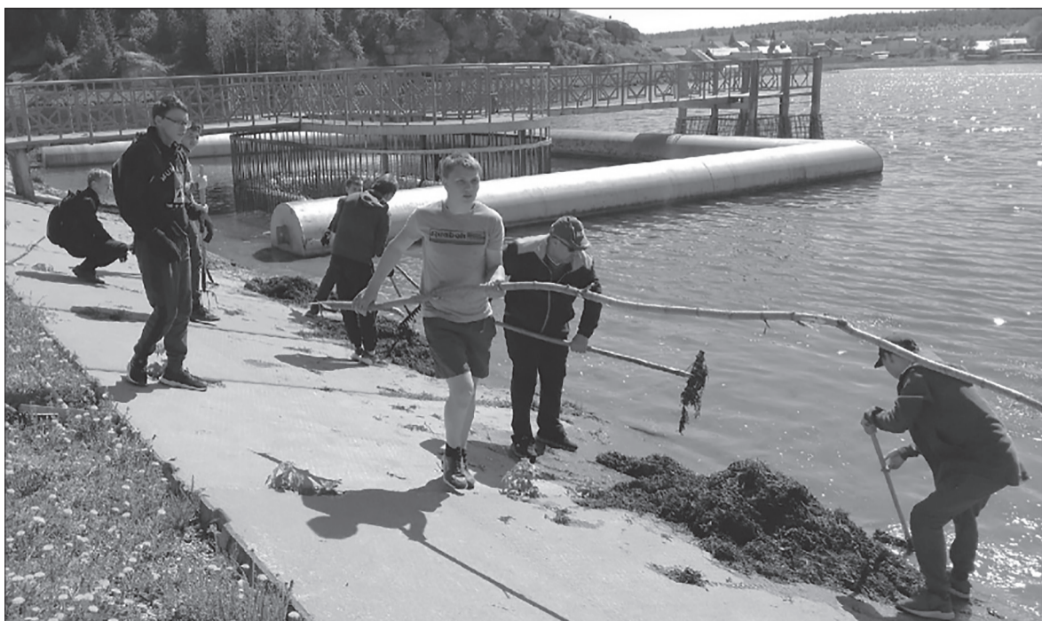
Очистка Уинского пруда – одна из самых значимых акций Центра волонтерства и добровольчества