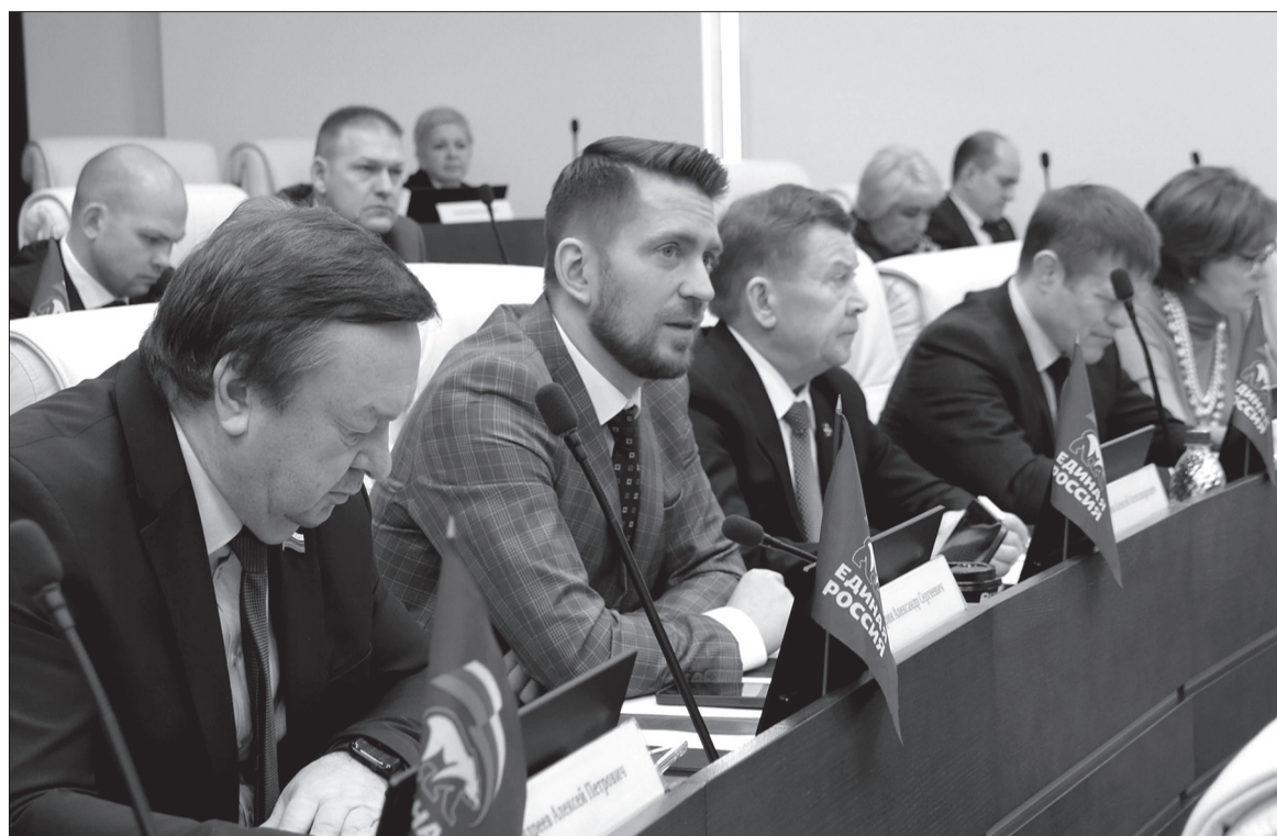
В уходящем году депутаты Законодательного Собрания Пермского края провели 10 заседаний. Большинство из них касалось непосредственно повседневной жизни жителей Прикамья

На модернизацию первичного звена здравоохранения потратят за три года более 4,7 миллиарда рублей. Задача – повысить качество и доступность медпомощи на селе. Планируется провести капремонт восьми медучреждений в шести территориях,