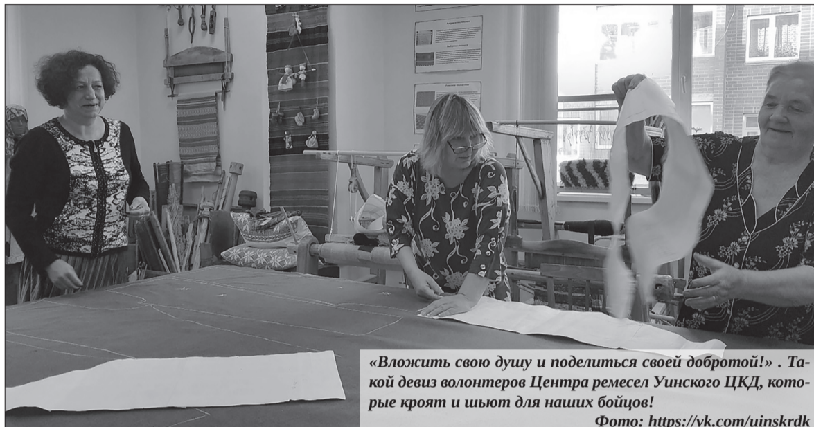
«Вложить свою душу и поделиться своей добротой!». Такой девиз волонтеров Центра ремесел Уинского ЦКД, которые кроют и шьют для наших бойцов!

– Самое сложное в работе Центра – это поднять людей, привлечь их, заинтересовать. Так сказать, нет мотивации у них. А нехватка людей ощущается довольно остро всегда. Нелегко так просто взять и набрать команду волонтеров. Мы никого не принуждаем и не заставляем. Стараемся находить волонтеров через группы в социальных сетях, через знакомых. Активных ребят на самом деле много, они приходят, зовут с собой других. Так, общими усилиями группы постепенно набираются. Но все