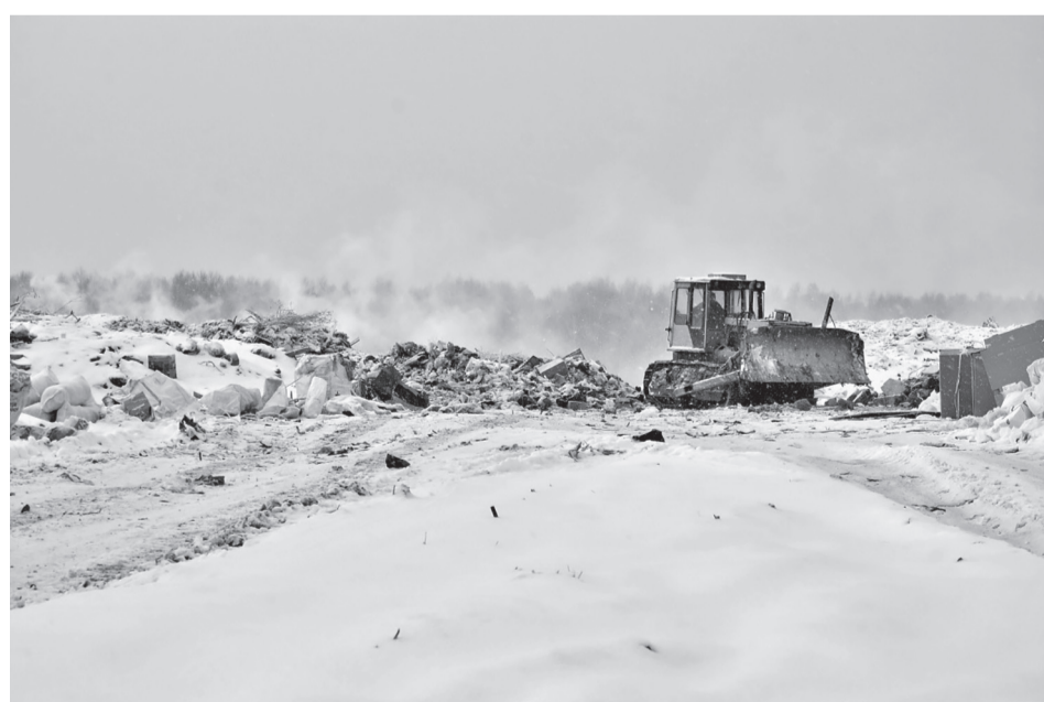
Предполагается, что мусор из Уинского района должны отвезти на ТБО п.Сарс.

Оператор обязуется обеспечивать сбор, транспортировку, обработку, утилизацию, обезвреживание, захоронение ТКО на территории Пермского края. Весь объем ТКО будет вывозиться только на лицензированные полигоны - их в Пермском крае 13. В случае обнаружения несанкционированной свалки региональный оператор должен известить об этом собственника земельного участка. Если собственника нет, то ответственность за захлавленную территорию будет нести муниципалитет.