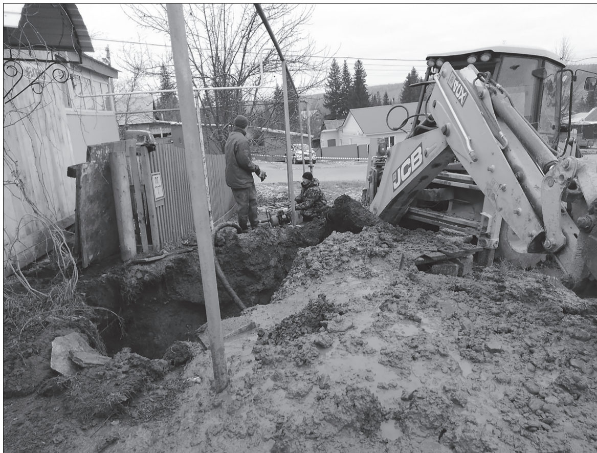
При отсутствии оборотных средств ремонтировать изношенные сети сложно