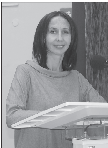
в работе детских садов, появилось что-то новое?

— Идет четвертый год с момента вступления в силу Федерального государственного образовательного стандарта дошкольного образования. Что изменилось за это время