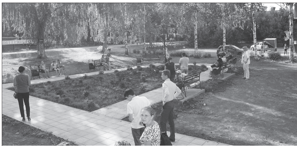
Один из возможных объектов благоустройства. Вы можете предложить свой вариант

– В рамках подготовки к реализации этого проекта мы провели целый ряд встреч с жителями многоквартирных