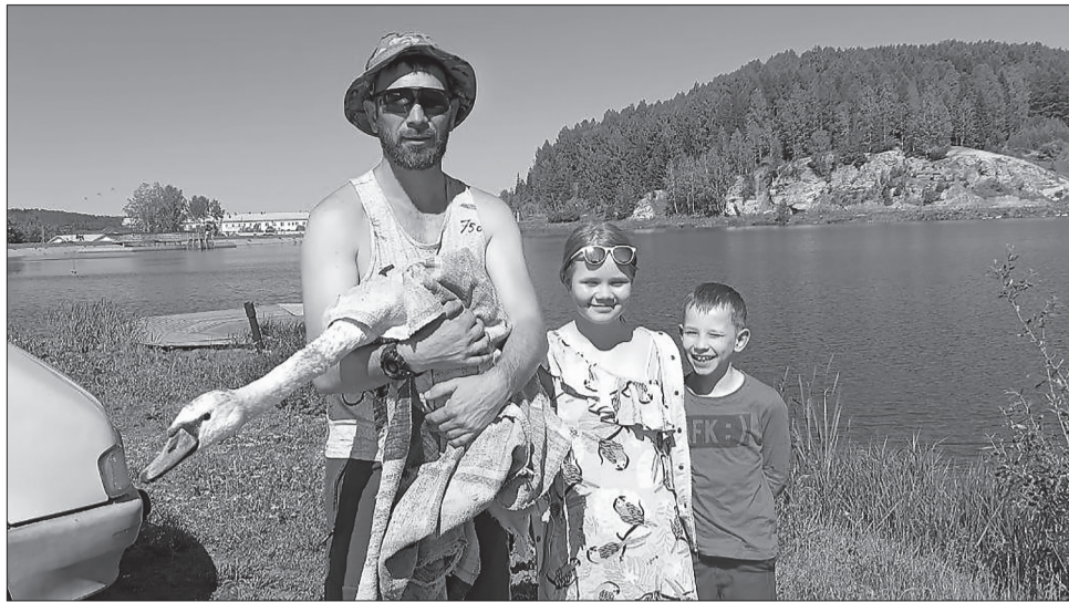
Весной 2023 года лебеда отпустили на «вольные хлеба» в Уинский пруд

- Первые две недели с ним пришлось очень непросто. Он почти ничего не ел, постоянно расплескивал воду, а две излишне любопытные курицы и вовсе лишили жизни. Не знаю, кто больше боялся: он меня или я его?! Как начнет