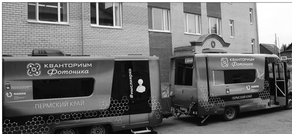
Мобильный кванториум уже посещал Уинскую школу - в 2019 году

27 ноября состоялось торжественное открытие работы «Кванториума». Событие значимое и волнительное как для ребят, так и для учителей, ведь с этого момента их ждет много нового и интересного. Школа станет территорией изобретательства, инженерно-технического творчества, естественно-научных открытий и сотрудничества. В течение двух недель наставники технопарка будут проводить уроки и мастер-классы для старшеклассников. Ребята Уинского муниципального округа смогут попробовать себя в нескольких направлениях: