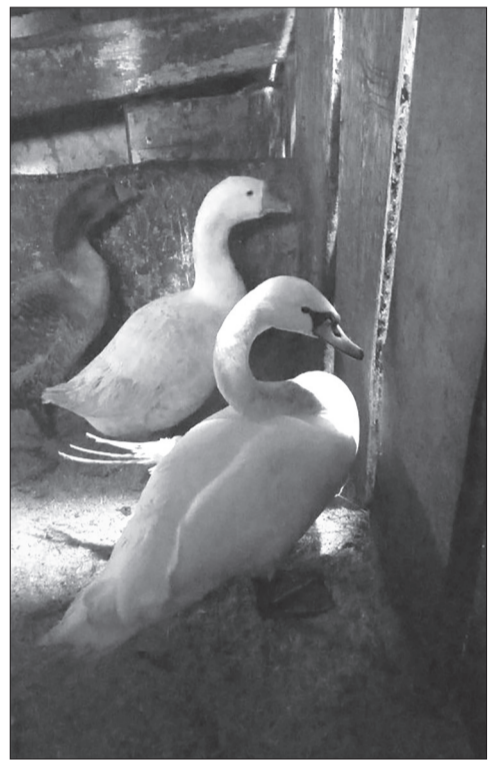
Прошлую зиму лебедь прожил в компании с курами. В этом его соседями будут гуси

Чем питаются лебеди? Пшеницей, кукурузой, горохом. Также их рацион можно разнообразить овощами - морковью, кабачками, капустой, различной зеленью, а также творогом и рыбным фаршем.