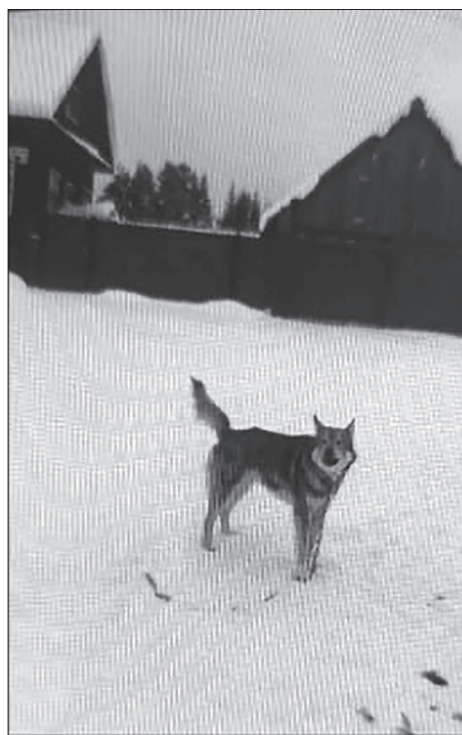
Пес, которые по сообщениям пользователей Вконтакте облаивал детей идущих в школу/из школы

прошлом году на территории Уинского округа нам рассказали в Управлении по благоустройству администрации округа.