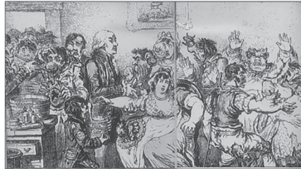
Статья в газете Тайм в августе 1796 г. «Прививки коровой оспой приведут к вырождению рода человеческого в коров - у вакцинированных отступит рог, копыта и вымя (в зависимости от пола)»

Мифы о вакцинации возникли сразу, как только Э.Дженнер сделал первые прививки от оспы в 1796 г.