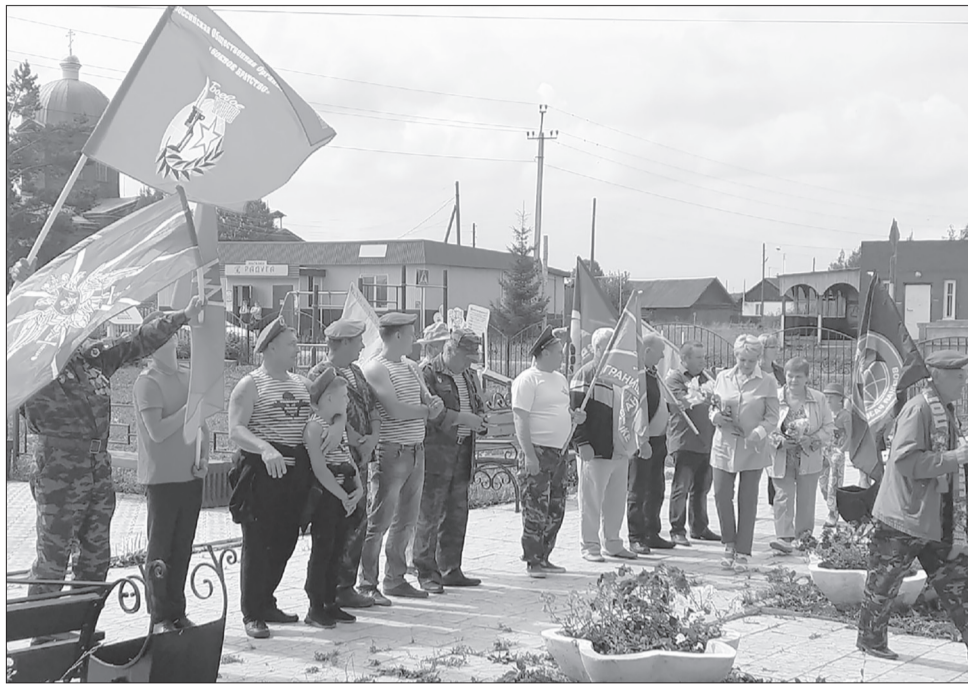
Районный автопробег 26 июля

— Да, действительно, 2020 год выдался непростым. В связи с пандемией пришлось работать в условиях ограничений, запретов и самоизоляции. Многие из запланированных мероприятий либо переносились, либо были усечены, а то и вовсе отменены. Но благодаря нашему тесному сотрудничеству и всесторонней поддержке со стороны администрации Уинского муниципального округа, Управления культуры, спорта и молодежной политики, Управления образования, краеведческого