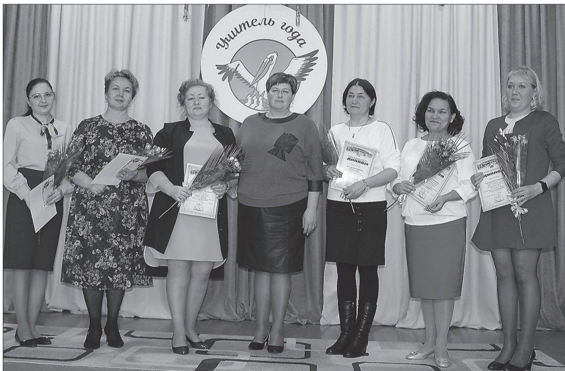
Призеры муниципального этапа конкурса «Учитель года-2022»