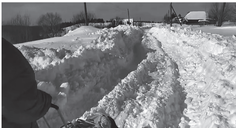
Так себе подарок к 8 марта подготовили для жительниц улицы Ленина в с.Асна. Дорога по улице очищена едва ли наполовину.