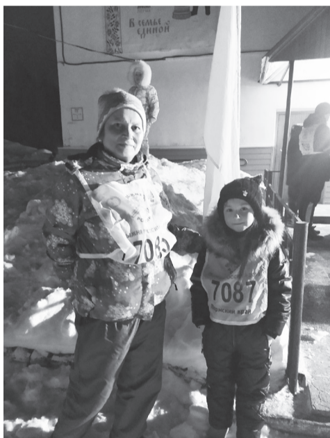
Участники первого ночного забега в с.Уинское

Организаторы суешились, вели регистрацию участников, раздавали нагрудные номера, предлагали горячий чай, прикрепляли на одежду ночных бегунов светоотражающие