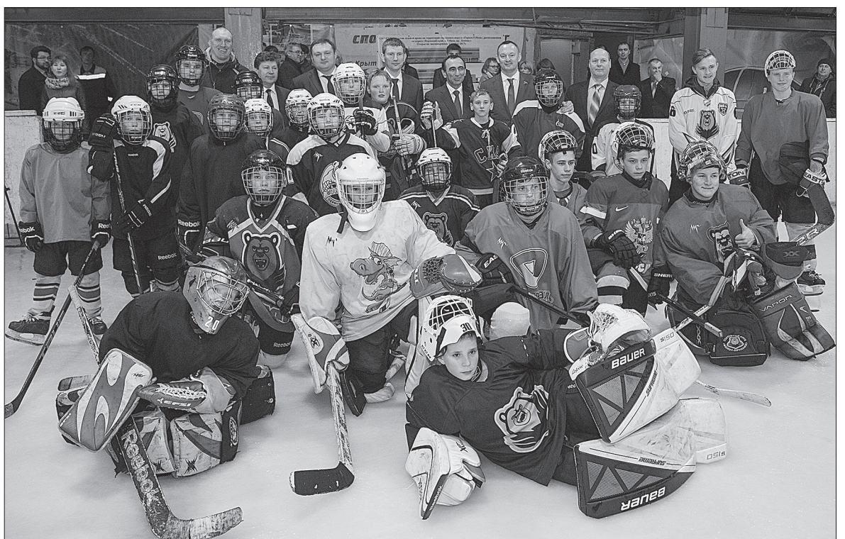
Ледовая арена спортивно-досугового центра «Губахинский»