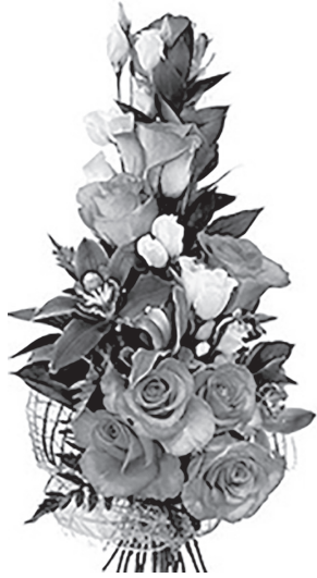
Муж, дети внуки.

С Днём Рождения поздравляем! Нынче праздник только твой! В этот день тебе желаем Жизни долгой и большой. Быстро пролетают годы, Только стоит ли грустить? Никакие пусть невзгоды Омрачить не смогут жизнь! Мы желаем сил, здоровья, Много планов и идей, Вдохновения с любовью, Мира, светлых новостей! Пусть как в детстве улыбнётся Солнце в небе голубом, В душу пусть тепло прольётся, Дом наполнится добром! Всех благ тебе, родная!