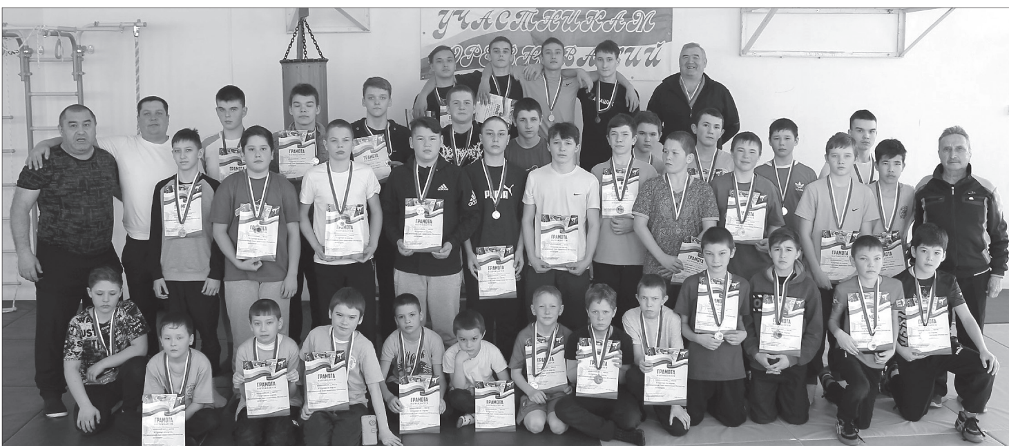
27 февраля 2024 года, участники соревнований по борьбе Корэш. Итоги на с.7