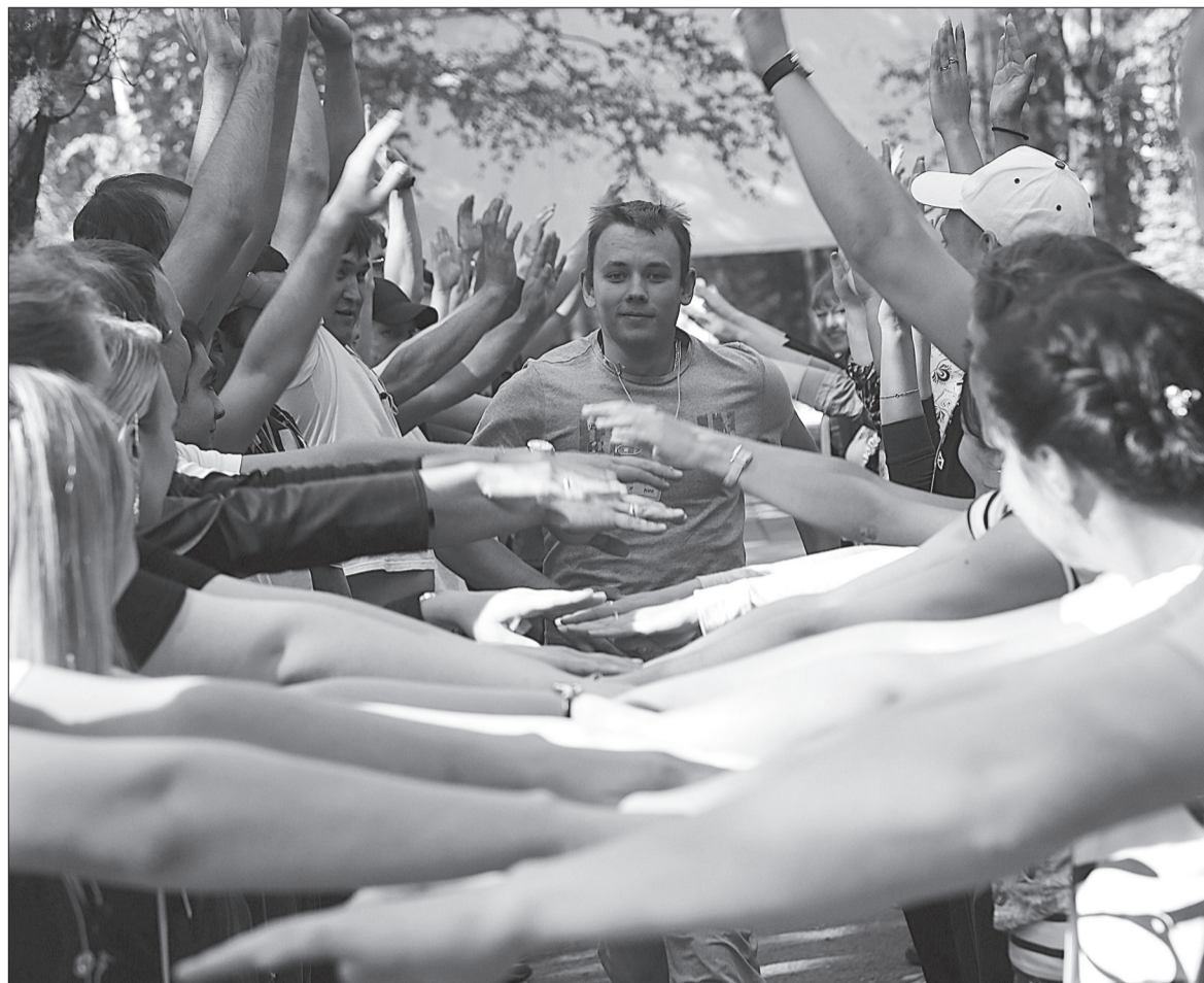
На форумах молодых парламентариев есть место и для серьезного разговора, и для игры.

му спектру вопросов жизни Прикамья. За два года Молодежным парламентом инициированы проекты 10 законов Пермского края, в том числе касающихся государственной молодежной политики, ограничений в сфере розничной продажи слабоалкогольных и безалкогольных тонизирующих напитков, административных правонарушений, социальной поддержки семей, имеющих детей и др. К некоторым законопроектам приняты поправки, подготовленные членами Молодежного парламента. Благодаря Молодежному парламенту у каждого депутата краевого Законодательного Собрания появился свой помощник из молодежной среды. Члены парламента самостоятельно ведут личные приемы граждан в общественных приемных депутатов, политических партий и Законодательного Собрания.