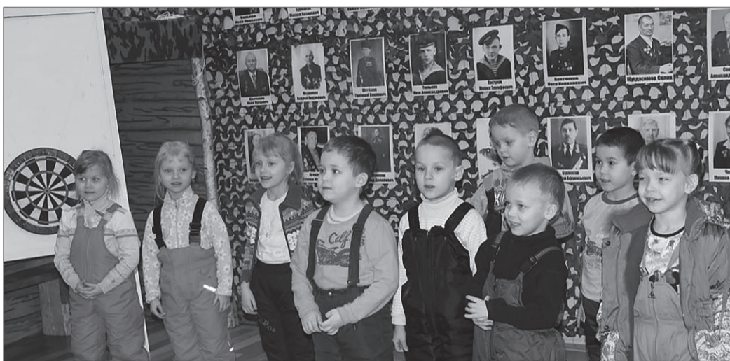
Дартс-викторина «Сталинградский раунд»

Привлечение детей дошкольного возраста в музей в высшей степени целесообразно. Поскольку именно в этот период важно зажечь искру любви и интереса. Ведь своео-