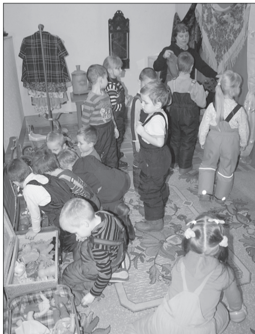
Экскурсия по выставке Краснокамской фабрики деревянной игрушки «У Лукоморья»