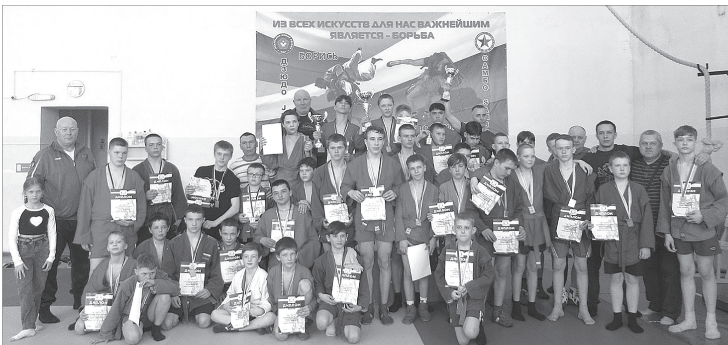
Уинские самбисты привезли 5 медалей из Елово. Подробности читайте на с.4