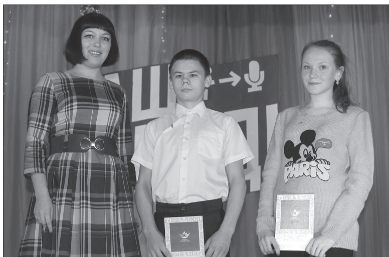
«Гордость Пермского края» – будущее района

Среди конкурсантов учителя Уинской средней школы, работники финансового управления, управления строительства и ЖКХ, управления учреждениями культу-