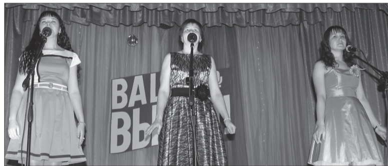
Сладко пела «Карамель»