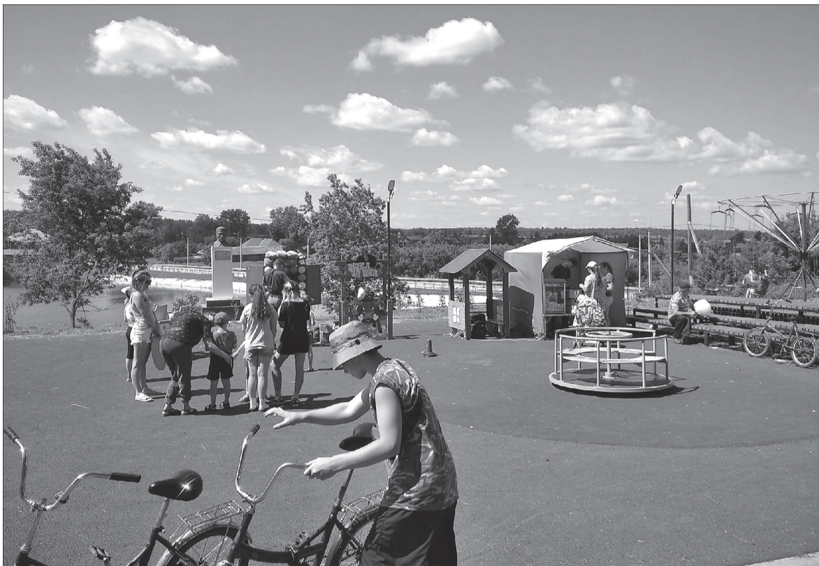
Здорово, что в центре села появилось место, где можно поиграть и заняться спортом, говорят судинцы

Как малые поселения становятся благоустроенными