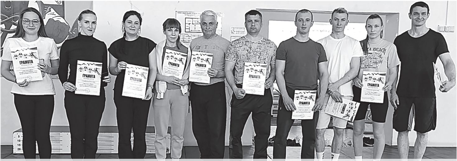
29 марта на базе МКОУ ДО «УИНСКАЯ ДЮСШЕ «ЮНИКС» прошёл фестиваль ВФСК ГТО среди трудящихся коллективов. Участие приняли 9 организаций. Участники, которые показали наилучший результат в испытаниях ВФСК ГТО, были награждены дипломами. Команды, занявшие призовые места, были награждены дипломами и подарочными сертификатами. Тройка призеров выглядит так: 1. Отделение МВД России; 2. Краевой политехнический колледж; 3. Пожарная часть 92. А уже в эту субботу, 6 апреля, «Юникс» приглашает на фестиваль ГТО среди семейных команд. Открытие фестиваля в 11.00.