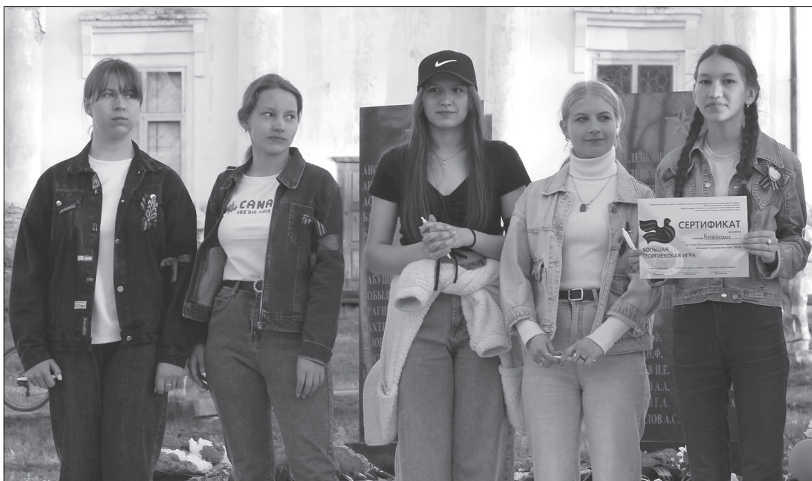
74 балла из 100 возможных набрала команда-победительница Большой Георгиевской игры-2023. Команда «Комсомолки», Уинская школа