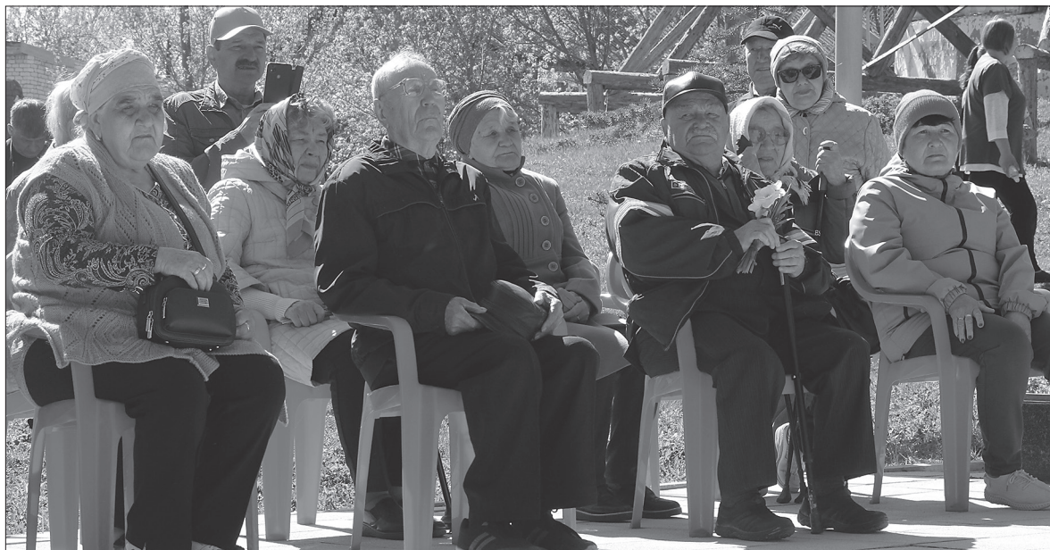
Больше снимков с митинга смотрите в наших соцсетях