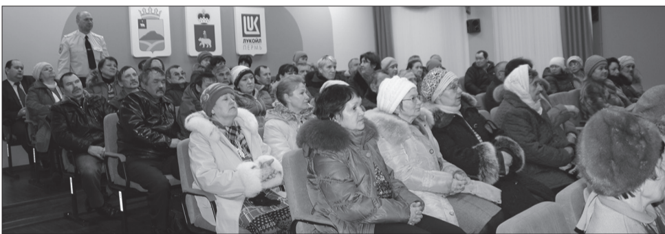
Традиционные встречи главы района с жителями в этом году начались в Ломовском сельском поселении

В Уинском районе начались сходы граждан. Первая отчетная сессия прошла 8 февраля в самом малонаселенном сельском поселении – Ломовском.