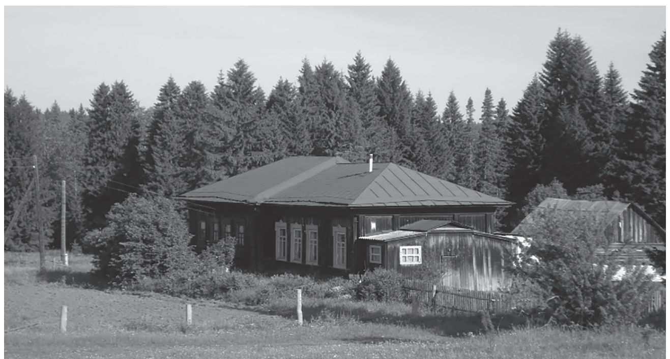
Храм Казанской Божьей матери, д.Салакайка