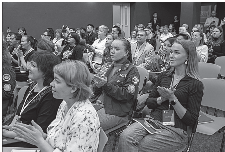
На площадке пермского кампуса Высшей школы экономики эксперты профессионального сообщества прорабатывают механизмы оказания помощи подрастающему поколению в выборе путей профессиональной и личностной самореализации.