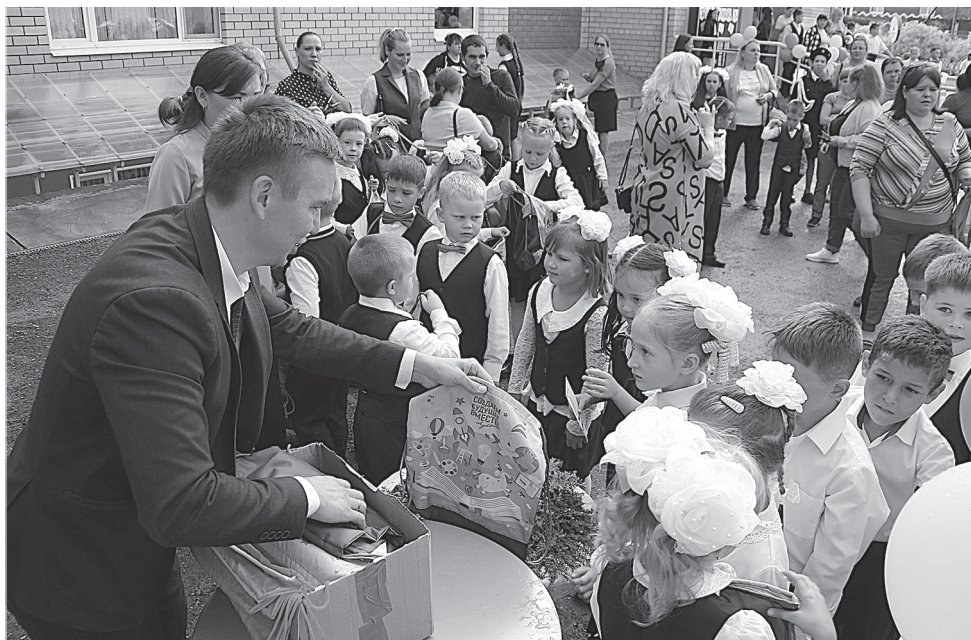
Подарки от нефтяников получили 110 первоклассников Уинского муниципального округа

Теперь у ребят начинается школьная жизнь, где им необходимо преодолеть путь до школы самим. И чтобы путь первоклассников от дома до школы был безопасным, нефтяники дарят полезные подарки, ведь книжки-раскраски помогут научиться правильно вести себя в разных ситуациях на улице и на дороге.