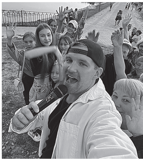
которые мы могли увидеть на праздничных программах на День молодежи и на Медовом Спасе.

В рамках реализации проекта летом работали 3 танцевальные площадки в Уинском, Аспе и Суде, и соответственно - 3 обучающиеся группы. Было проведено 43 мастер-класса, где 53 начинающих танцора подготовили 16 танцевальных батлов и 2 массовые танцевальные композиции,