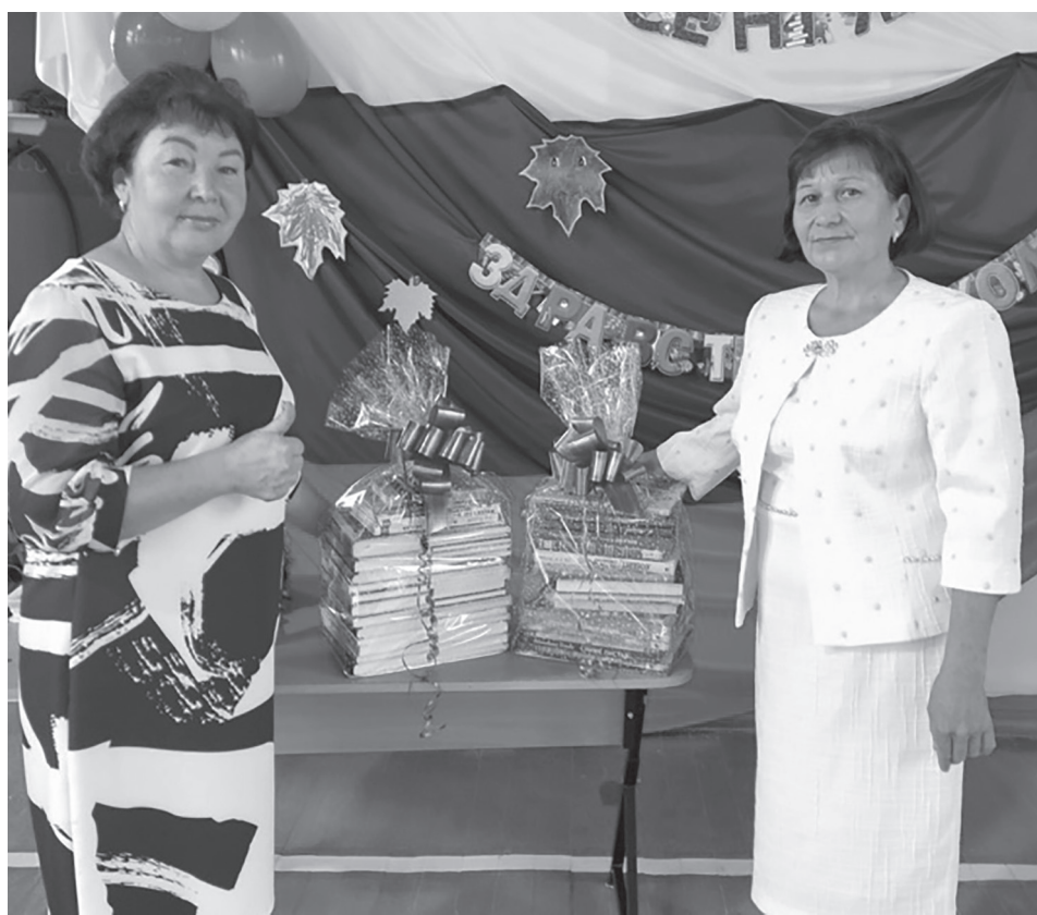
В школьные библиотеки с.Верхний Сып и с.Суда переданы наборы замечательных книг

Сейчас, когда практически всё можно найти в интернете, про классические носители информации всё равно забывать нельзя, так же, как и сто лет назад, книга - это и источник знаний, и лучший подарок.