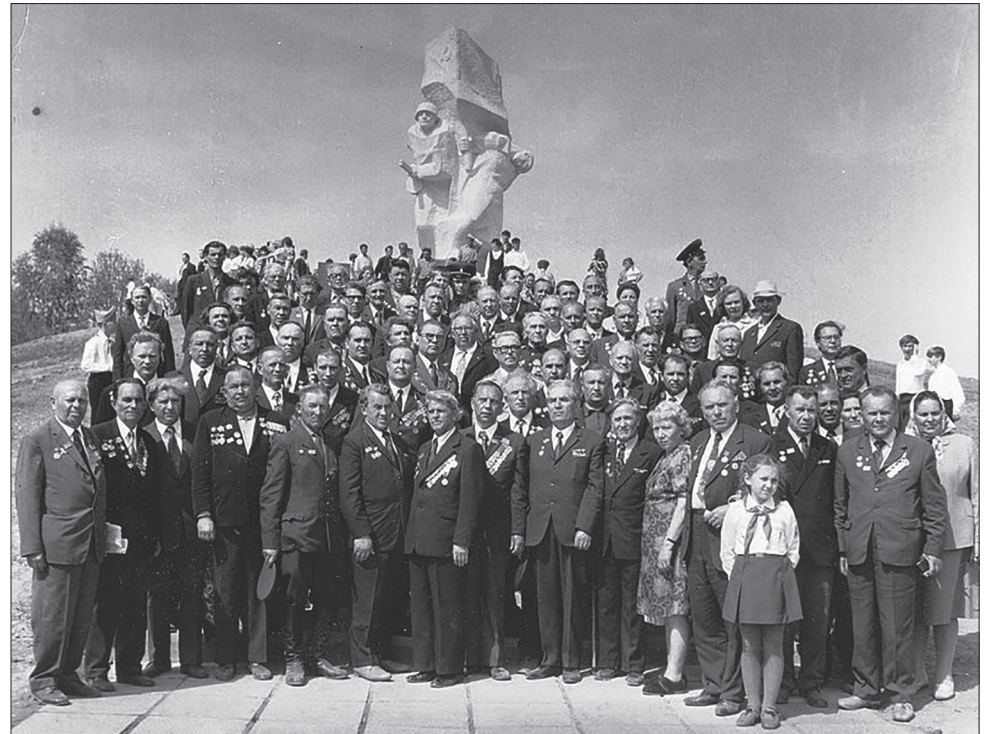
8 мая 1975 года. Бывшие курсанты на открытии памятника в Ильинском

Река Изверь. Типичная небольшая река Центральной России, длиной всего в 72 километра, протекает на территории Калужской области. Именно здесь, у тихой речки, передовой отряд подольских курсантов принял свой