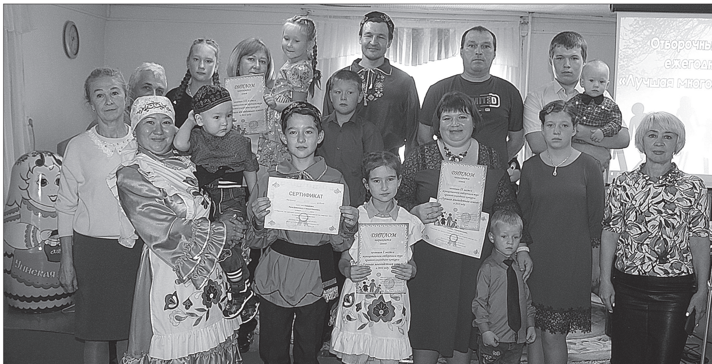
В с.Уинское прошел конкурс «Лучшая многодетная семья». Подробности на с. 3