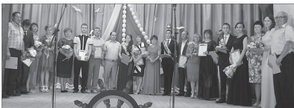
Победители номинации «Честь и слава выпуска»

отметила, что Уинский район показал лучший результат в крае по нормам ГТО, у него 11 золотых знаков! Директор спортивной школы вручила выпускникам, принимавшим участие в тестировании норм ГТО специальные удостоверения и золотые знаки, пожелав при этом не останавливаться на достигнутых результатах, а добиваться еще больших высот в жизни.