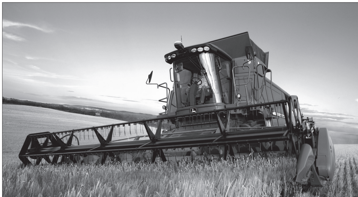
На 20 тыс. га увеличились посевные площади

— Безусловно, хорошие моменты есть. Несмотря на экономические сложности, правительство помогает развивать сельское хозяйство. В прошлом году в агропромышленный сектор вместе с федеральными и краевыми деньгами было направлено 3,4 млрд руб. Увеличилась выручка сельхозпредприятий. Второй год растут посевные площади: они стали на 20 тыс. га больше. Субсидирование этого направления, так называемая «погектаровка», является неплохим стимулом к работе, тем более, что правительство теперь вовремя даёт этот вид финансирования. Раньше