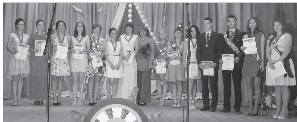
Победители номинации «Умники и умницы»