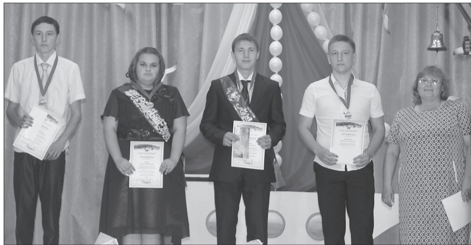
Победители номинации «Вдохновители сердец»