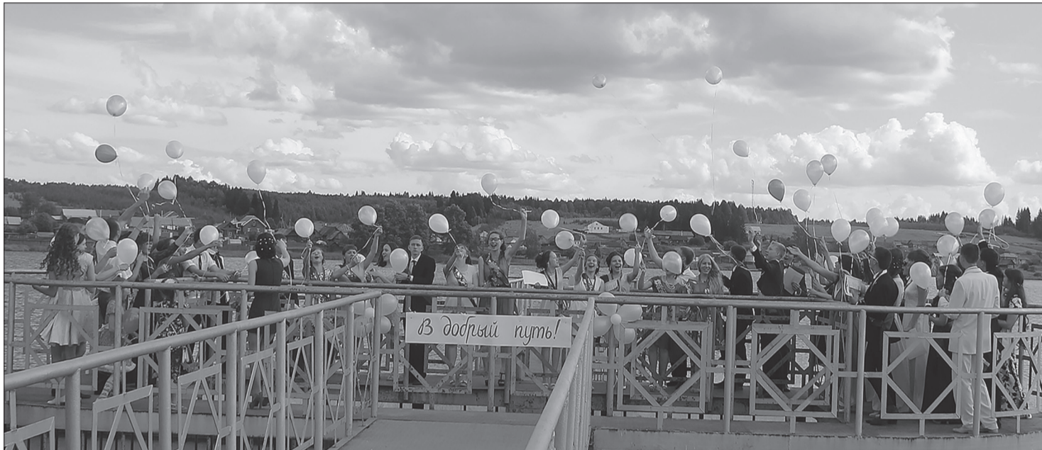
24 июня в райцентре прошел районный выпускной бал. Подробности на с.3