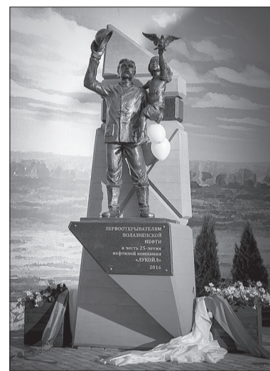
В Полазне открыли памятник первым добытчикам «чёрного золота»