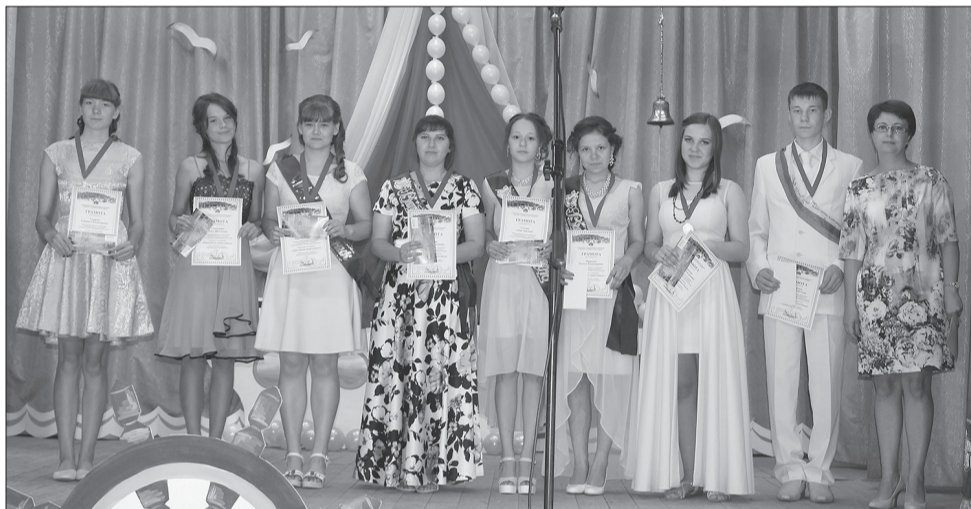
Победители номинации «Окрыленные творчеством»