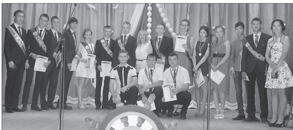
Победители номинации «Покорители вершин»