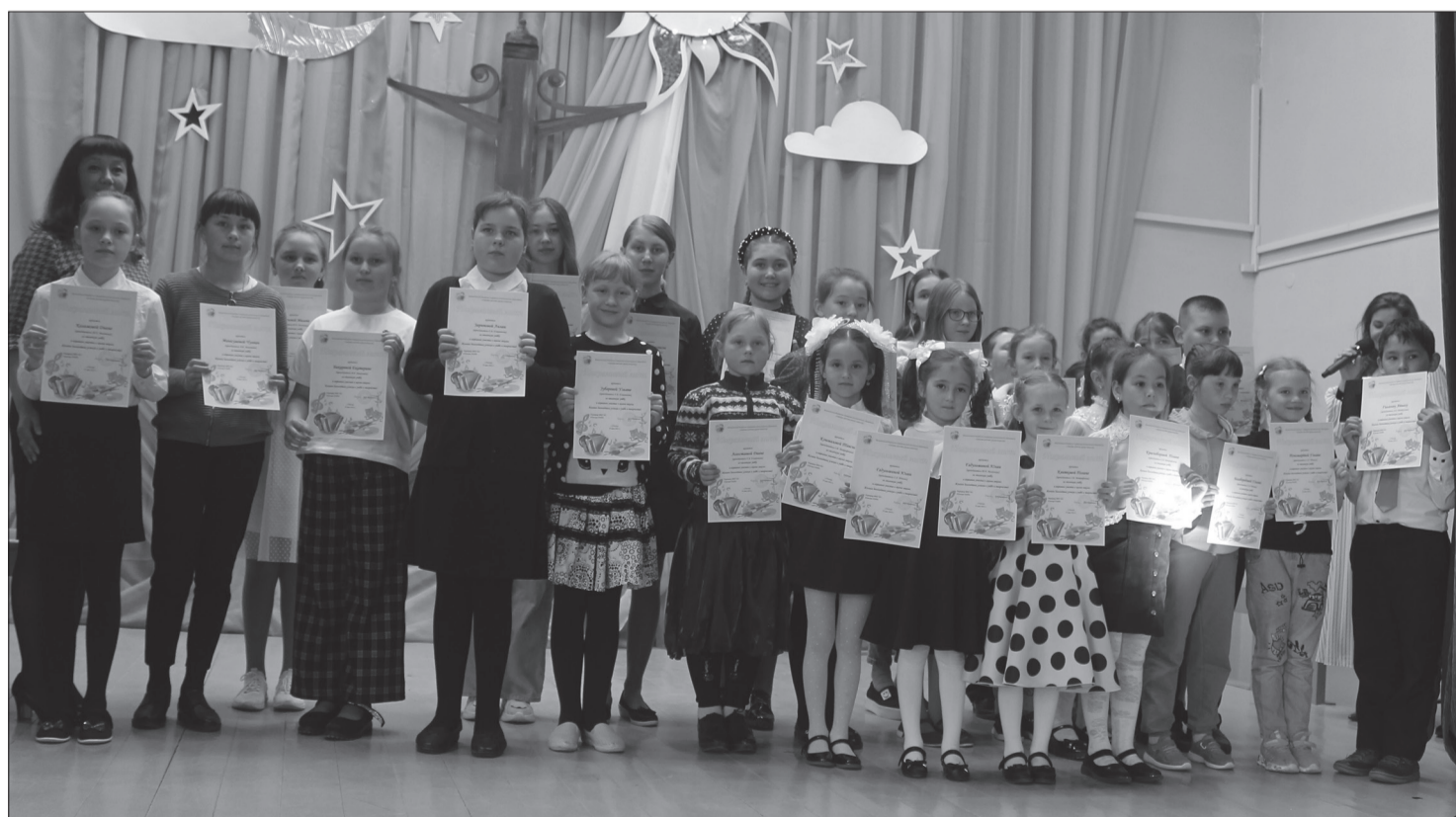
Ученики ДШИ, которым вручили грамоты. Больше фото на нашем сайте