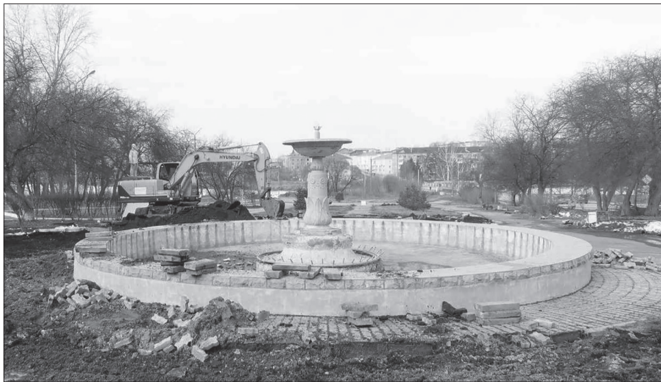
Проголосовать за проекты по благоустройству можно на Едином общероссийском портале za.gorodsreda.ru .

– «Зелёный город» – символическое название. Хочу, чтобы наш город действительно был зелёным, а не напоминал пустырь, похожий на пространство между детским садом и